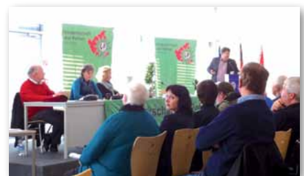
Erneut viele interessierte Kolleginnen und Kollegen im Präsidium.

Insgesamt gibt es in diesem Bereich viel Unwissenheit. In einem interessanten und sehr informativen Vortrag erläuterte Rechtsanwalt Stege die theoretischen Grundlagen des Versorgungsausgleichs. Angereichert mit praktischen Beispielen folgte eine