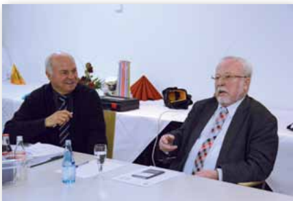
Ein wirklicher Zeitzeuge im Gespräch: Herr Lothar de Maizière.

Symbolfigur der „Friedlichen Revolution“ für viele; Kirchen in Ost-Berlin, z. B. Gethsemanekirche und Zionskirche (Dietrich Bonhoeffer) mit gegenüber liegender Bibliothek/Druckerei der Friedens- und Umweltbewegung in der DDR; Maueropfergedenken an der Bernauer Straße, Checkpoint Charly, „Tränenpalast“ am Grenzübergang Friedrichstraße, heute als Museum; das Deutsch-Russische Museum – Ort der Kapitulation in Berlin-Karlshorst; Stasi-Gefängnis Hohenschönhausen und last, but not least Bundestag und Bundeskanzleramt, hier die Begegnung mit der Hamburgerin Aydan Özoguz, Staatsministerin