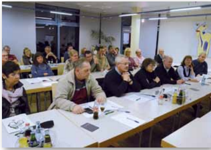
Interessierte Seminarzuhörer beim Vortrag des letzten Ministerpräsidenten der DDR, Herr Lothar de Maizière.

Prenzlauer Berg, Brandenburger Tor, Alexanderplatz, Eastside Gallery, Wohnhaus von Bärbel Bohley – einer