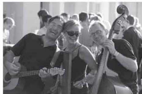
Sgt. Feffers Fun Fun Band

15. November 2014 20.00 Uhr, Einlass 19.30 Uhr Grand Elysee Hamburg Rothenbaumchaussee 20148 Hamburg