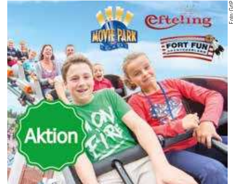
Eine gute Zeit mit der Familie erleben: GdP-Mitglieder können vergünstigt ausgewählte Freizeitparks besuchen.