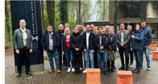
Tief bewegt: die Teilnehmerinnen und Teilnehmer der GdP-Gedenkstättenfahrt in Westerbork

Mit diesem Wissen besuchten die Kolleginnen und Kollegen dann Westerbork. Von dort wurden in den Jahren 1942 bis 1944 mehr als 107.000 Juden, Sinti und Roma per Zug deportiert und ermordet. Nur etwa 5.000 überlebten. Schon das gezeigte Material im Museum war verstörend, noch stärker erlebbar wurde die Grausamkeit des NS-Regimes allerdings durch eine Geländeführung. Die niederländische Begleiterin erzählte u. a., dass die Lagerinsassen sich vor Ort selbst organisieren mussten. Der