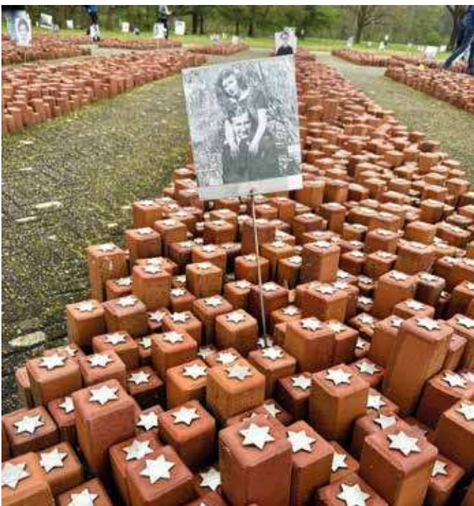
Das Monument „De 102.000 Steenen“: Jeder Stein steht für einen ermordeten Deportierten.

Der letzte Tag des Seminars fand wieder am Ausgangspunkt in der Villa ten Hompel statt und galt der Reflexion. Aber wie fasst man ein derart intensives Seminar zusammen? In diesem Zusammenhang wurden „Werte“ diskutiert, die es damals und heute gab und gibt und an denen sich Polizeibeschäftigte orientieren: „Ehrlichkeit, Rechtschaffenheit, Loyalität, Vertrauen“ wurden vielseitig genannt. Dabei wurde klar, dass diese Begriffe dehnbar sind und nicht für jeden zu jeder Zeit das Gleiche bedeuten. Und damit war die abschließende Frage nach dem „Kann so etwas nochmal geschehen?“ am Ende nicht eindeutig zu beantworten. ■