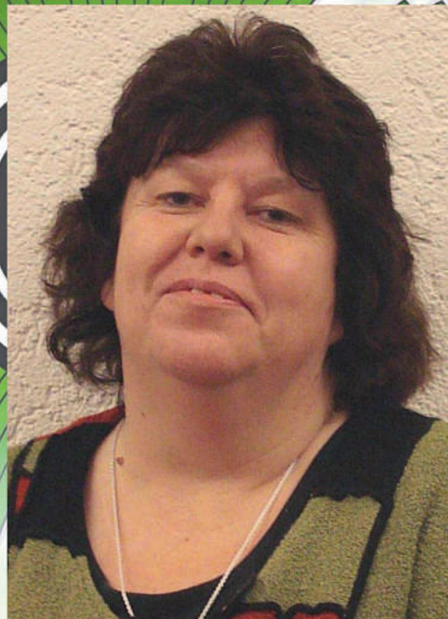
Ute Edeler Direktion