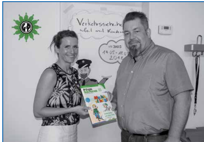
Übergabe der GdP-Malhefte

Die unterrichtsbegleitenden Utensilien kommen selbstverständlich den Kindern zugute, verschaffen aber unmittelbar einen positiven Zu-