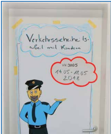
Thema des Seminars

Verkehrssicherheitsarbeit mit Kindern. Ein wertvolles Thema, welches wir als GdP gerne unterstützen. Be-