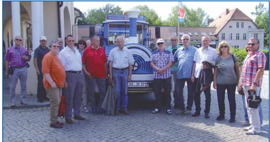
Unsere Truppe mit dem „Kleinen Landstreicher“

Mit freundlichen Grüßen, Müller, PHM i. R.