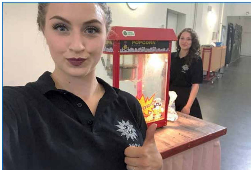
Mit süßem Popcorngruß