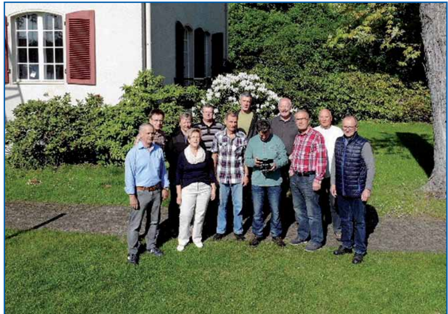
Mal aus ner anderen Perspektive aufgenommen

mit auch wir, die Seniorinnen und Senioren, erreicht werden, bedarf es der persönlichen Anmeldung auf der Homepage der GdP-Brandenburg. Wer also von unseren Gedanken, Ideen und Terminen erfahren möchte, den bitten wir, sich anzumelden bzw. die hinterlegte E-Mail-Anschrift zu prüfen und diese für den Empfang der Newsletter freizuschalten. Am besten Ihr nutzt gleich die Anleitung auf Seite 3. Unser Teilnehmerkreis sieht darin einen wichtigen Startschuss für alle Aktiven. Optimisten meinen, dass wir