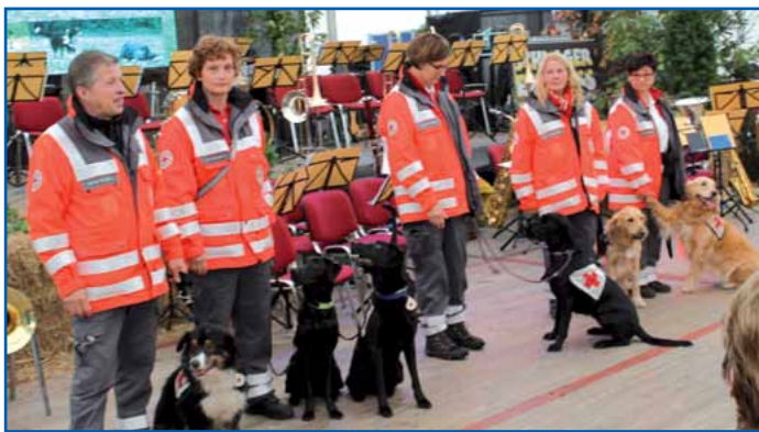
Mitglieder der Rettungshundestaffel

renamtlich tätig ist, eine Veranstaltung mit dem Polizei-Orchester organisieren und die Besucher dafür keinen Eintritt bezahlen, sondern am Schluss der Veranstaltung um eine Geldspende bitten. Es wird seitens des Herbstkracher-Vereins sorgfältig geprüft, wem sie ihr Festzelt dafür zur Verfügung stellen. Die DRK-Rettungshundestaffel Finsterwalde ist ein kleiner Verein mit 21 Mitgliedern. Sie sind diejenigen, welche mit ihren eigenen Hunden an 365 Tagen und nachts einsatzbereit sind, um zu jeder Zeit, wenn es erforderlich ist, vermisste Personen zu suchen. Sie müssen sich selbst finanzieren und erhalten keine Unterstützung. Sie schulen und trainieren das ganze Jahr lang ihre lieben Vierbeiner um zu helfen. Das Landespolizei-Orchester ist in Vollbesetzung mit 44 Männern und einer Frau nach Finsterwalde gekommen, um mit Blasmusik unsere Bürger zu erfreuen. Das große Festzelt war voll besetzt, ein Zeichen, dass die Blas-