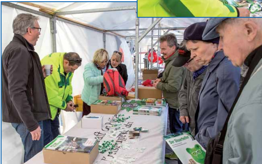
Reger Andrang am Stand der GdP