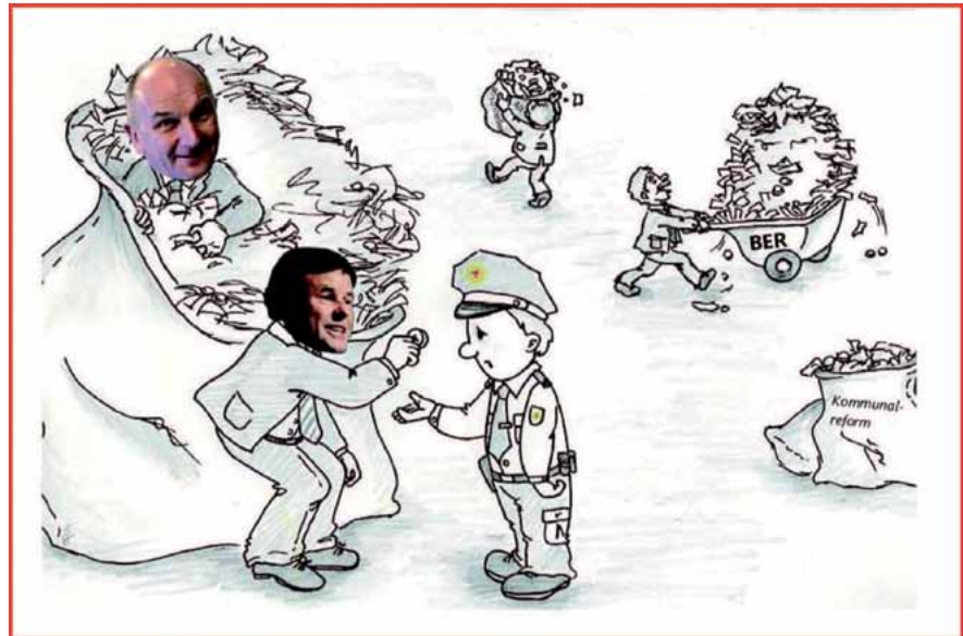
Hab' leider nur noch 'nen schmalen Taler übrig für die Polizei

Im Anschluss erklärte uns der Finanzminister, dass der Tarifabschluss eine hohe finanzielle Belastung darstellt, er aber das Ergebnis auch als Zeichen für die Beschäftigten im ö. D. sieht. Allerdings sei für die Übernahme des Tarifergebnisses für die Beamten keine Haushaltsvorsorge getroffen worden! (Wie bitte? Jeder weiß doch,