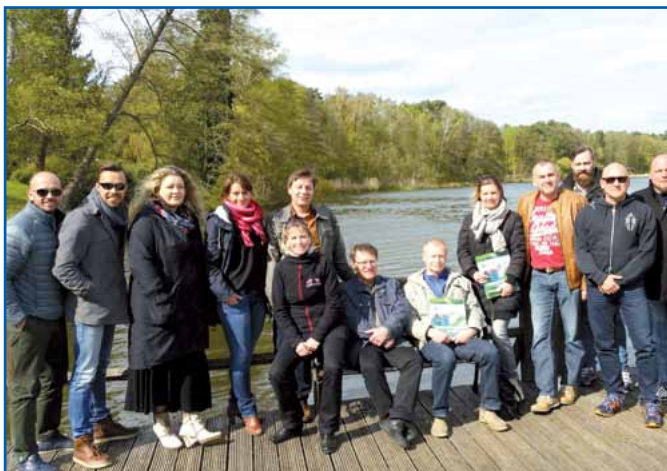
Die Vertrauensleute der Kreisgruppe

Landes Brandenburg noch von Minustemperaturen und Regenschauern heimgesucht wurde. Mit hohen Erwartungen trafen sich 17 Vertrauens-