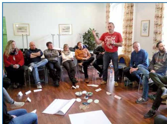
Auswertung der Arbeitsergebnisse

ensleute des Stammpersonals, um über ihre Ideen, Aufgaben und Verantwortlichkeiten in der zukünftigen Kreisgruppenarbeit zu spre-