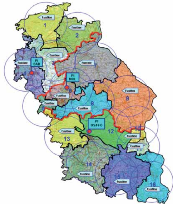
Streifenbezirke Polizeidirektion Ost (15-km-Reaktionsradius)