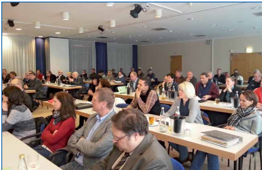
Großes Interesse an der Fachtagung der GdP.

Dies geht nur, wenn alle Beteiligten an einem Strang ziehen. Und hier