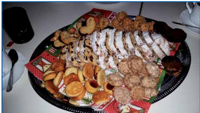
Lecker, lecker ...

monstration am 9. November dieses Jahres und dem Ergebnis des darauffolgenden Spitzengesprächs am 21. November zwischen der GdP und dem Innen- und Finanzminister.