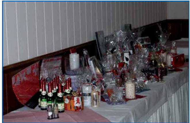
Die Tombola mit vielen schönen Preisen