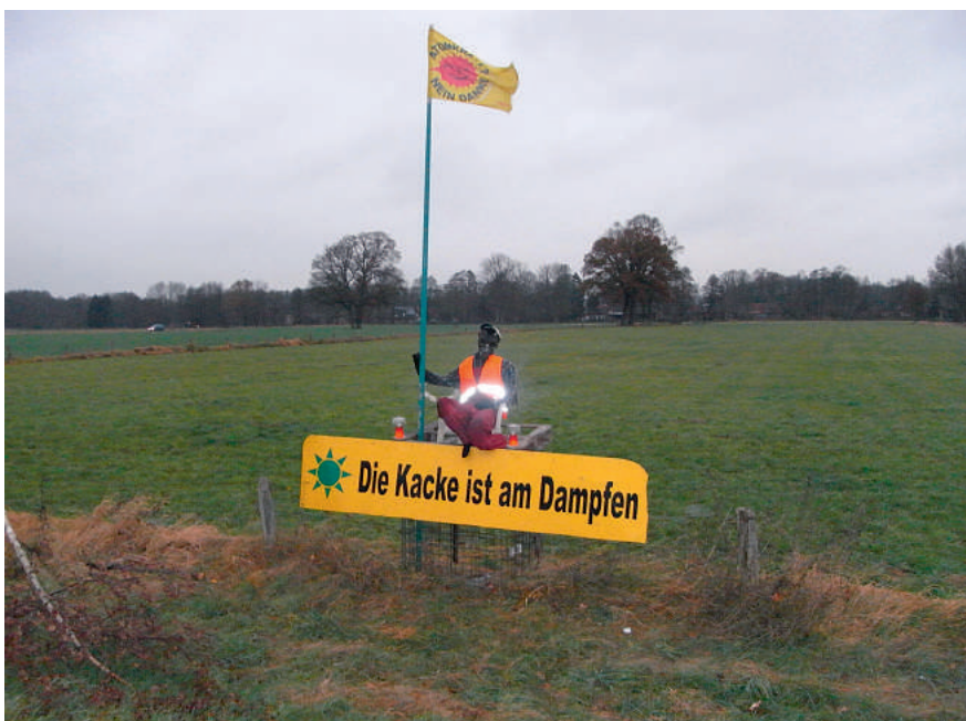
So kann man's auch ausdrücken ...

lein“ bzw. „Weiblein“ abgestellt wurde. Der Gesamteinsatzleitung dürfte es aber bekannt sein, dass die Bereitschaftspolizei nicht „gleichgeschlechtlich“ ist, was sich dann bei der Bettenberechnung hätte auswirken müssen.