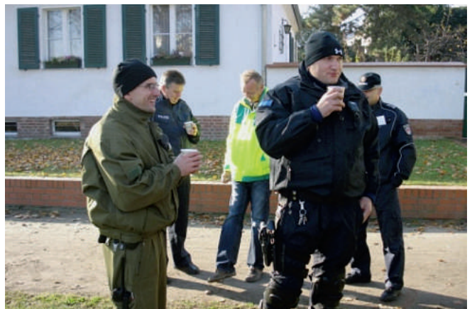
Kaffee – immer willkommen