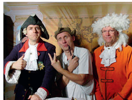
Die Akteure des Preußischen Kartoffelabends

Am Freitagabend erfolgte eine Führung durch die Altstadt von Angermünde.