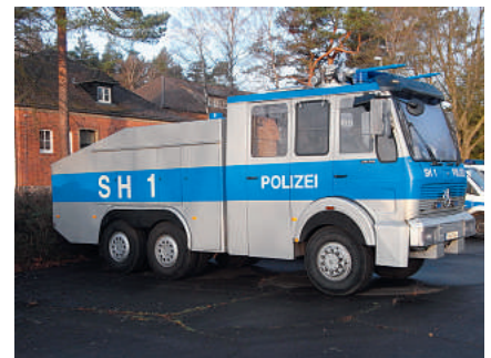
Der neue Wasserwerfer – die haben's gut, die haben wenigstens noch welche ...

ungsteam von GdP-Personalratsvertretern begleitet. Ziel war es, als Ansprechpartner für die Kollegen zu fungieren.