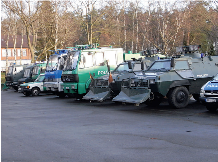
Technik aller Art und ohne Ende ...