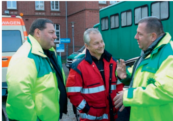
Auch der PÄD wurde nicht vergessen

Fest steht schon heute: Es war nicht die letzte Betreuungsmaßnahme. Ebenfalls