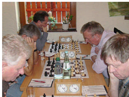
Grübel, grübel und studier ...

Vor dem Beginn der Meisterschaft im Turnierschach am 1. November 2011 mit dem Start der ersten Runde ermittelten am 31. Oktober 2011 nachmittags und am 1. November 2011 vormittags 22 Teilnehmern in sieben Runden im Schweizer-System den Sieger im Schnellschach. Beim