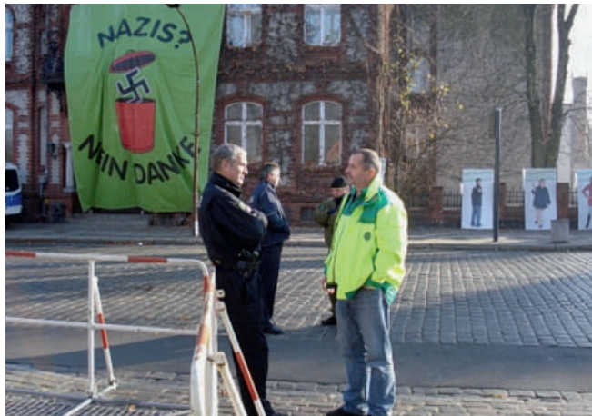
Nazis – nein danke – klares Bekenntnis

An den Einsatzabschnitten wurde unser Betreuungsteam schon mit den Worten „Wir haben euch schon erwartet“ empfangen. So kamen wir schnell ins Gespräch; über die GdP, über den Dienst, aber auch Privates kam nicht zu kurz. Betreuungseinsätze mit solchen Rückmeldungen und herzlichen Empfängen sind immer wieder eine tolle Erfahrung, machen Spaß und motivieren.