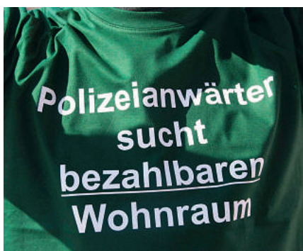
Von der Landesregierung im Stich gelassen.

rinnen und Mitarbeiter sind das Wertvollste der Landesverwaltung“ – so Ministerpräsident Matthias Platzeck.