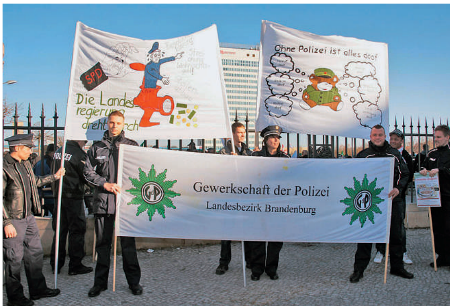
Junge Beschäftigte fordern gerechte Bezahlung.

Gemeinsam mit vielen Sympathisanten wurde erreicht, dass sich der Landtag mit den beispiellosen Kürzungen in der Brandenburger Polizei befassen muss. 97.000 Bürgerinnen und Bürger haben die Forderungen der GdP und der Vertreter der betroffenen Kommunen unterstützt. Ein überwältigendes Ergebnis, mit dem wir als Landesverband bundesweit