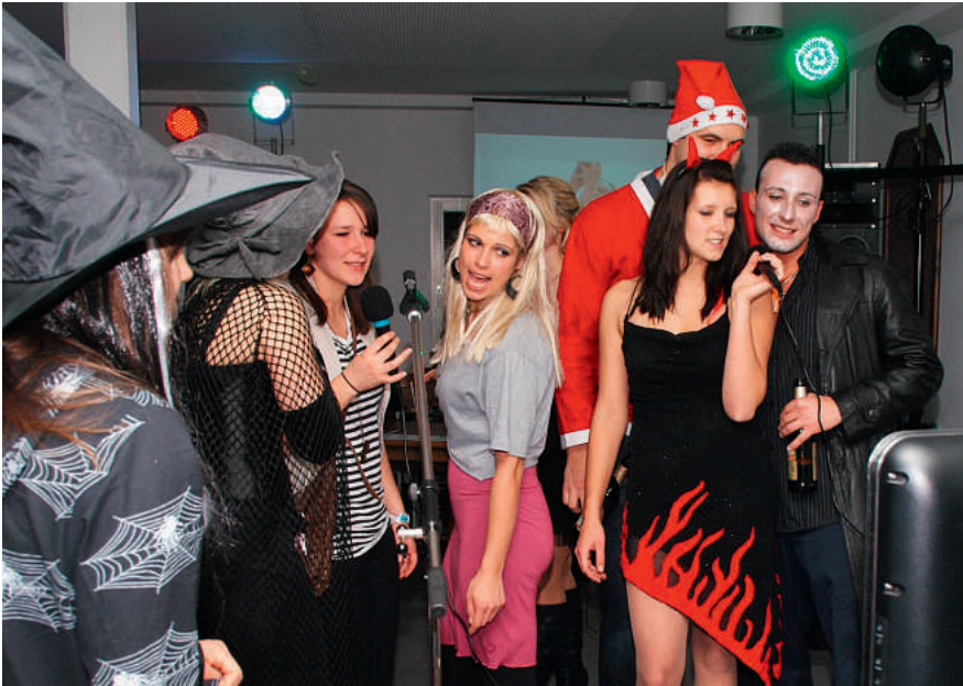
Gemeinsame Freude – von der GdP unterstützt!

der Polizei bietet ihren jungen Kolleginnen und Kollegen deshalb Leistungen an, die entweder durch den Mitgliedsbeitrag abgegolten sind oder durch Gruppen- bzw. Rahmenverträge zu besonders günstigen Konditionen in Anspruch genommen werden können.