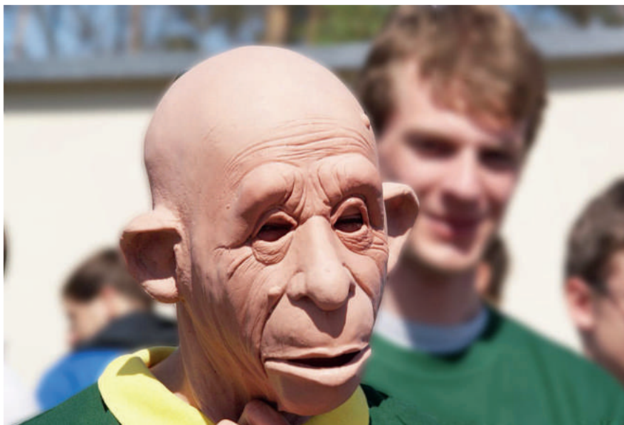
Spektakuläre Aktion gegen die Überalterung der Polizei.

Liebe junge Kolleginnen und Kollegen, herzlichen Glückwunsch zu eurer Berufswahl und alles Gute für die nächsten Jahre und Jahrzehnte. Wenn auch tätliche Angriffe gegen die Polizei zugezogen haben: Ihr habt euch für einen Beruf entschieden, der von der übergroßen Mehrheit der Gesellschaft anerkannt wird. Das verdeutlichen Untersuchungen namhafter Meinungsforschungsinstitute. Unsere Ausstattung kann sich im bundesweiten Vergleich sehen lassen. Und – rein theoretisch – steht die Landesregierung hinter uns. „Unsere Mitarbeite-