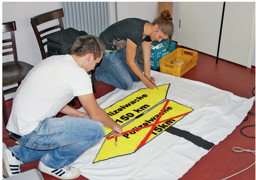
Die Plakate der Jungen Gruppe sind landesweit bekannt.

Fast alle Komponenten unserer Ausbildungs- und Studienbasis sind auf einem guten technischen Stand. Ihr könnt eine funktionale Sporthalle, nach vielem Hin und Her einen ordentlichen Sportplatz und eine der modernsten Raumschießanlagen der Polizei Deutschlands nutzen. Die Lehrkabinette sind mit neuen audiovisuellen Geräten ausgestattet. Allerdings kritisieren wir als Gewerkschaft die nicht vorhandenen landeseigenen Gemeinschaftsunterkünfte und Einschränkungen bei der Nutzung der Außenanlagen. Es ist schade, dass es zudem auch (noch) keine feste Räumlichkeit für teamfördernde Veranstaltungen auf dem Campus gibt. Der jetzige Zustand darf nicht als abschließende Lösung betrachtet werden.