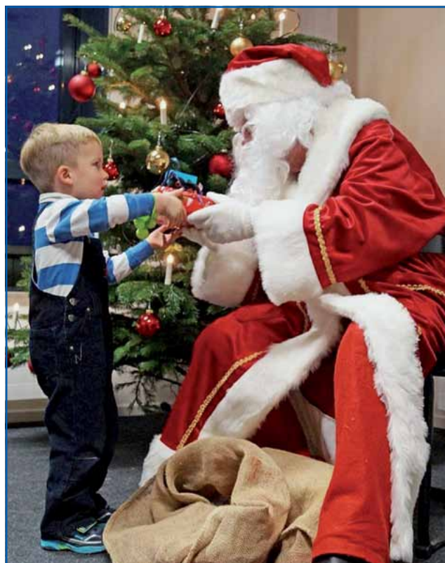
Diesmal gab's auch ohne Lied oder Gedicht Geschenke.

Und so stand dann einer ordentlichen Bescherung nichts mehr im Wege. Komisch war nur, dass keines der Kinder ein kleines Gedicht oder Lied für den Weihnachtsmann aufsagen konnte. War da zuvor bei der vielen Zauberei irgendetwas schiefgegangen? Waren am Ende nicht nur die Bilder aus dem Märchenbuch auf geheimnisvolle Weise ver-