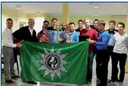
Skatturnier der Kreisgruppe

Um die trübe Jahreszeit mit Kurzweil zu vertreiben, war es unser fester Plan, an der FH die Skattradition