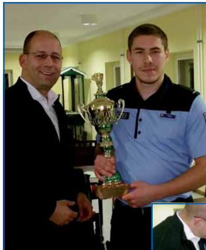
Der Sieger (r.)

Die Leistungsdichte war sehr unterschiedlich. Ich zum Beispiel, ein gutgelaunter Gelegenheitsspieler und zufrieden, wenn ich nicht vergesse, den Skat zu drücken oder zu be-