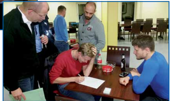
Auszählung der Ergebnisse

Wir danken für eure Teilnahme und tragt es ruhig weiter. An der FH kann man Skat „kloppen“.