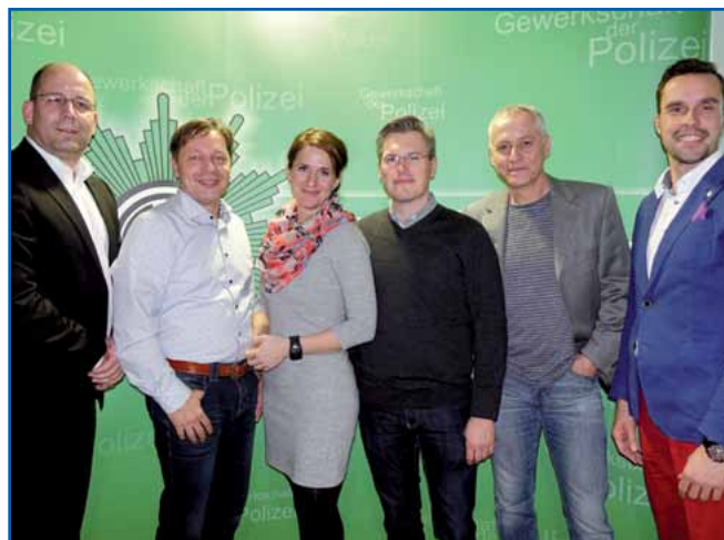
Der neue Vorstand