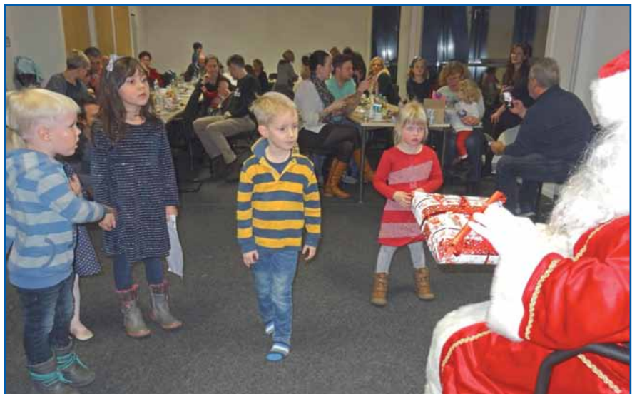
Neugier und auch Skepsis – so ganz geheuer war der Alte im roten Mantel dann doch nicht.