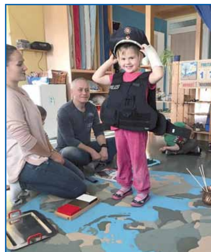
Bilder: Montessori-Kita Wandlitz

einer Kita bzw. einer Grundschule vorzulesen. Ich selbst fand diese Idee toll, zugegeben auch erst auf den 2. Blick. Neben dem allgemein erhofften Nutzen des Vorlesens war das eine gute Möglichkeit, Polizei als Institution und vor allem die Menschen, die in dieser ihren Dienst verrichten, den Kindern nahezu bringen. Gemeinsam mit meiner Ehefrau, Revierpolizistin in der PI Barnim, orga-