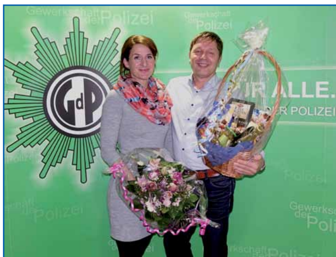
Glückwunsch an die neue Vorsitzende und den scheidenden Vorsitzenden

sammenhaltendes und des Miteinanders – Durchführung von zwei Skatturnieren pro Jahr und vieles mehr.