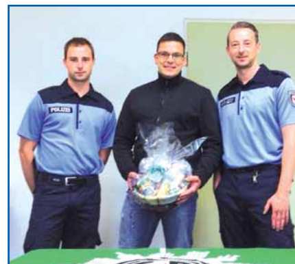
Die besten Wünsche für gute Besserung vom Grünen Stern .

Bei dem zweiten Kollegen ging es um eine simple Absperrmaßnahme am 13. 4. 2015 in Prenzlau im Rahmen eines Großbrandes. Dort hatten die Kollegen den Auftrag, sämtlichen