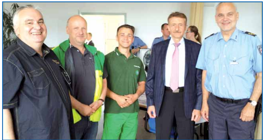
Im Gespräch mit Innenminister Karl-Heinz-Schröter

Somit ist für uns die Einsatzbetreuung nicht nur wichtig, um Probleme zu erkennen und zu deren Klärung