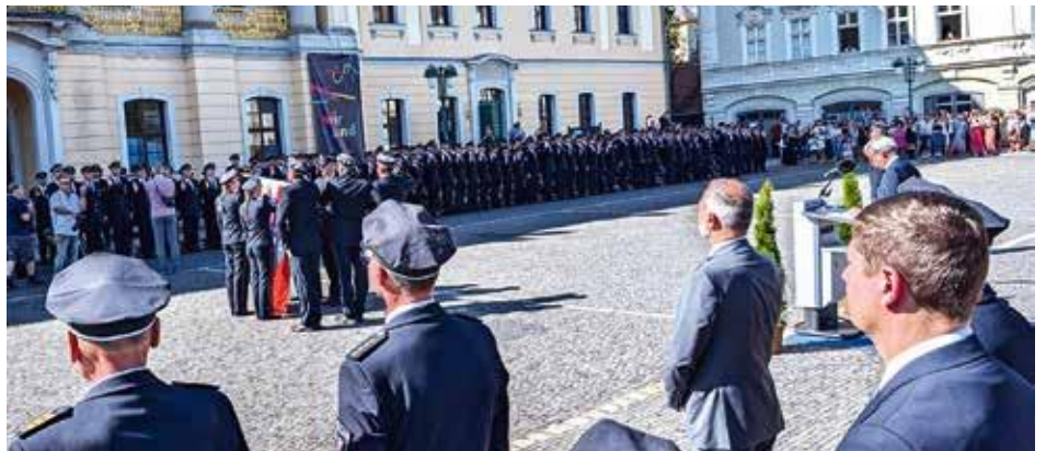
Ablegen des Eides ...

In Anwesenheit vieler Angehöriger der Anwärterinnen und Anwärter sowie zahlrei-