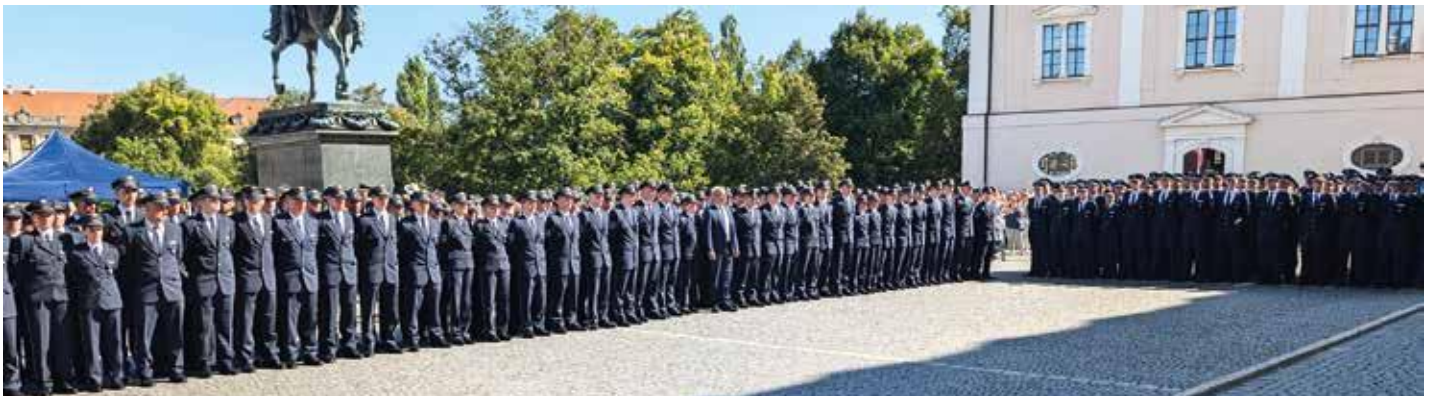
... vor historischer Kulisse

Für den feierlichen Höhepunkt der Veranstaltung marschiert das dreiköpfige Fahnenkommando zu Trommelwirbel mit einer großen Thüringenflagge ein. Als die Flagge ausgerichtet ist, kommen zwei Anwärterinnen und zwei Anwärter hinzu, heben die rechte Hand und sprechen wie all ihre Kollegen in den Reihen den Diensteid mit, den Innenminister Georg Maier vorträgt. Zum Abschluss der Veranstaltung ertönt die Nationalhymne, wo viele die dritte Strophe des Deutschlandlieds mitsingen. ■