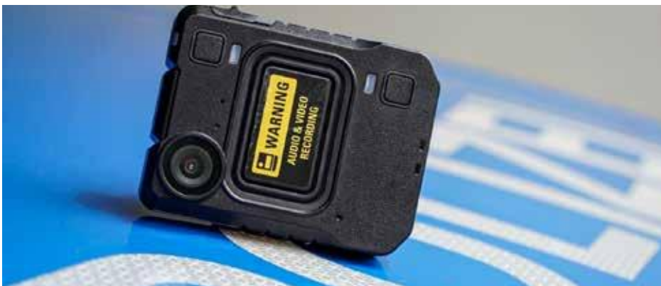
Die neue Bodycam

Bei den Geräten ist das sogenannte „Pre-Recording“, die Voraufzeichnung sowie die Speicherdauer der Aufnahmen, nach den Vorgaben begrenzt technisch umgesetzt. Auch der Ton sollte qualitativ hochwertig aufzeichnen, da mit Sprachaufzeichnungen nachträglich Handlungsabläufe besser geklärt werden können. Mitte Dezember 2023 wurde mit älteren Kameras in den Inspektionsdiensten Erfurt Nord und Süd der Interimsbetrieb aus dem Probebetrieb fortgesetzt. Im Januar 2024 folgte die Ausschreibung für die neue Technik, die von der Firma Motorola Solutions gewonnen wurde. Diese beliefert und wartet nun die neuen Bodycams. Ein guter Weg, den wir als GdP weiter begleiten, um die Gesetzesvorgaben zu verbessern. Dazu benötigen wir die Hinweise und Anregungen von euch. Daher scheut euch nicht und schreibt uns oder den Personalvertretungen eure Erfahrungen. ■