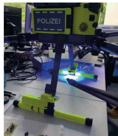
Rechtliche Voraussetzungen müssen umgesetzt werden, eine ist die Erkennbarkeit der Drohnen, das blaue Blitzlicht ist hierfür da.