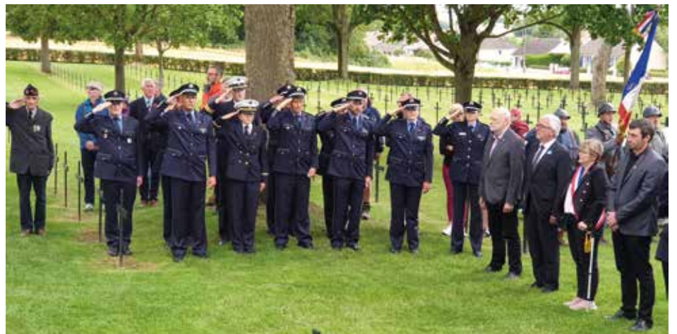
Die Gedenkfeierlichkeiten am 1. Juli 2023 in Fricourt fanden ihren Höhepunkt in der Kranzniederlegung