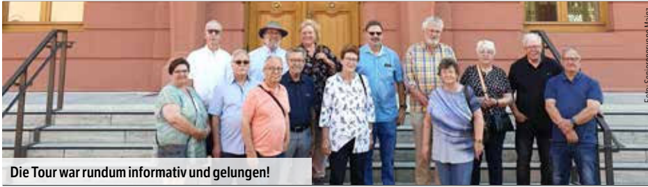
Die Tour war rundum informativ und gelungen!