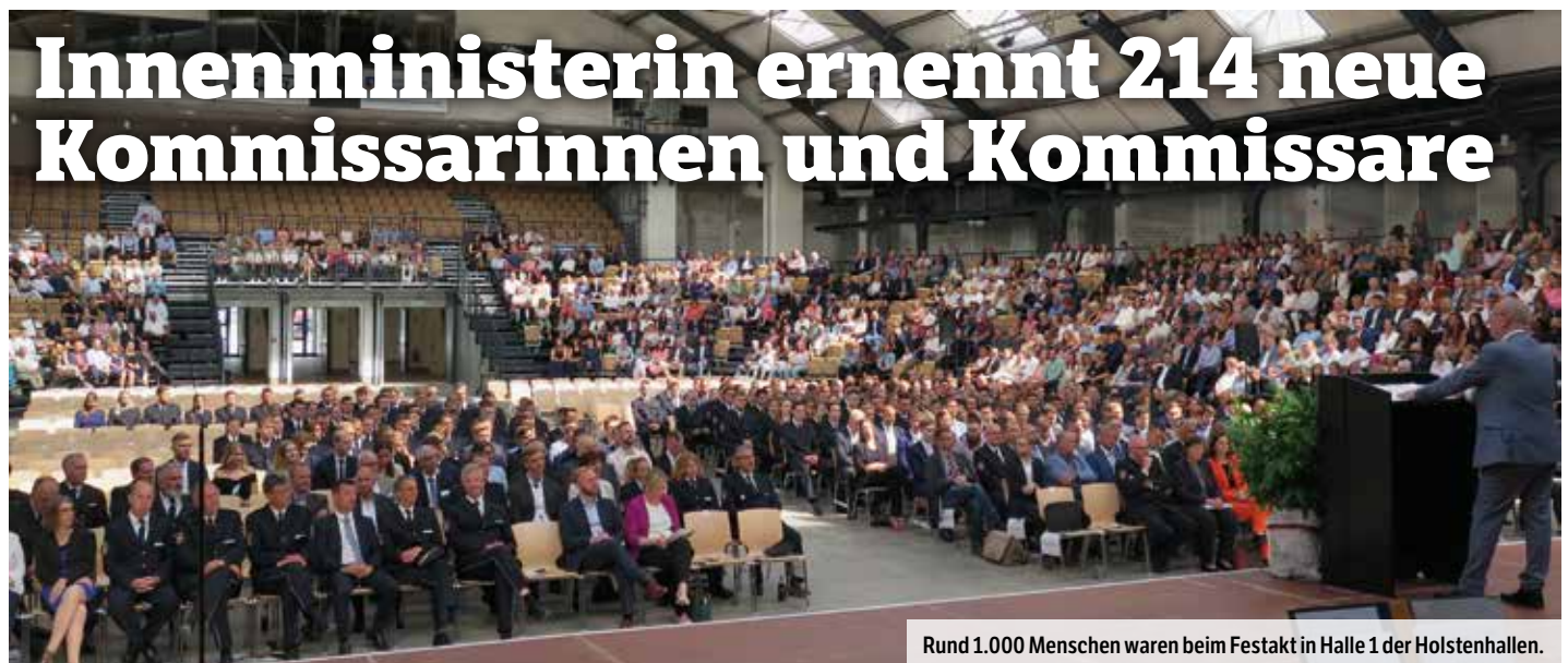
Rund 1.000 Menschen waren beim Festakt in Halle 1 der Holstenhallen.

Ergebnisse sind Ausdruck sehr guter Polizeiarbeit.