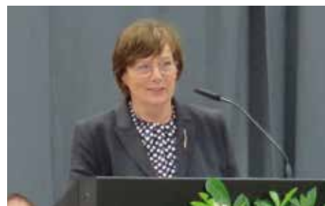
Innenministerin Sütterlin-Waack sprach beim Festakt.

Eröffnet wurde der Festakt zur feierlichen Verabschiedung des 14. Bachelorstudienjahr-