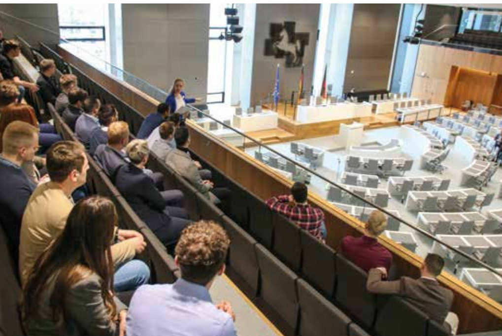
Im Rahmen einer Führung durch den Landtag konnten sich die Teilnehmenden einen Eindruck vom Regierungssitz in Hannover verschaffen.