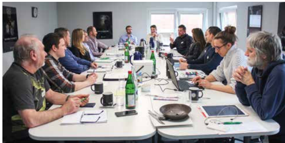
Die Mitglieder des Fachausschusses Kriminalpolizei bei ihrer ersten Sitzung 2023.