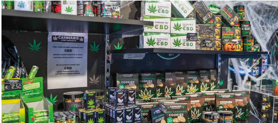
Einige Cannabidiol-Produkte (CBD) sind bereits im freien Verkauf.

zen auch gegenüber der Steuerverwaltung angezeigt werden müssen? Wie ergibt sich ein Verdacht? Steht dann im Zweifel der Zoll vor der Tür, ein zuständiges Amt oder die Polizei oder alle gemeinsam?