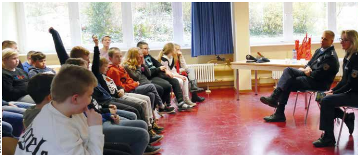
Den Kindern der dritten und vierten Klasse der Ahorn-Grundschule in Berlin-Friedrichshagen brannten viele Fragen unter den Nägeln.