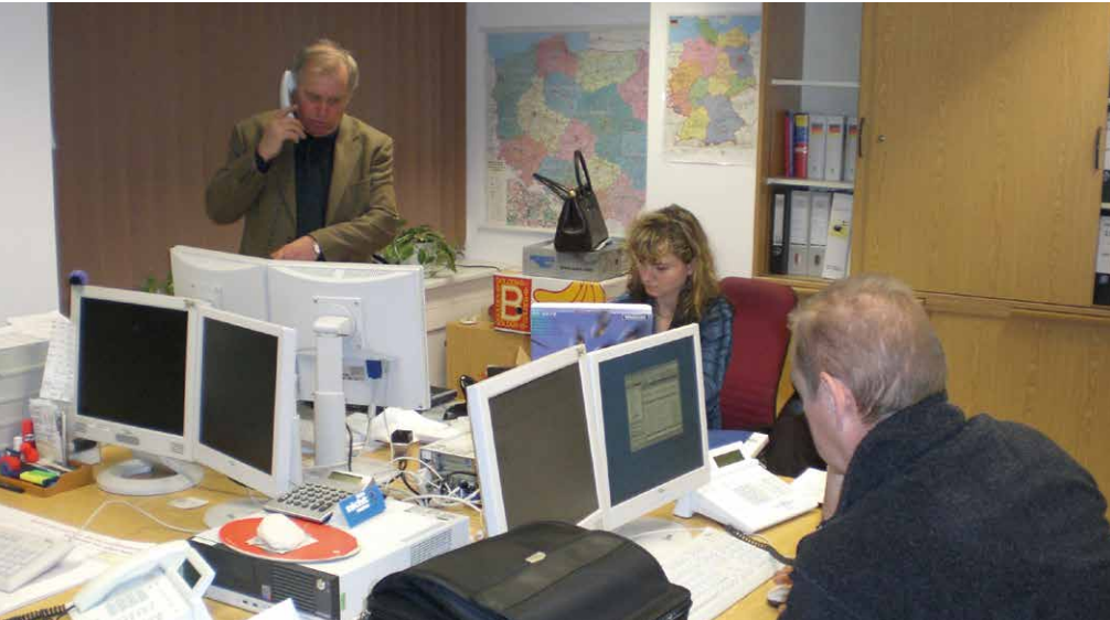
Der künftige Tagesdienst des Brandenburger Polizeikontingents bei der Übernahme des neuen Büros