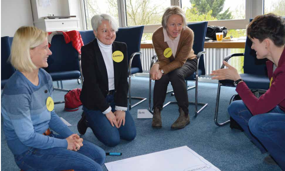
Projekte zur Personalentwicklung gehören zu den Arbeitsschwerpunkten der Frauengruppe (Bund).