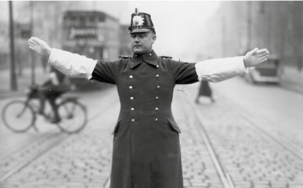
Verkehrspolizist in Berlin, 1930.