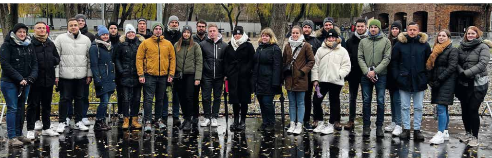
Die Seminarteilnehmenden in der Gedenkstätte Auschwitz-Birkenau.