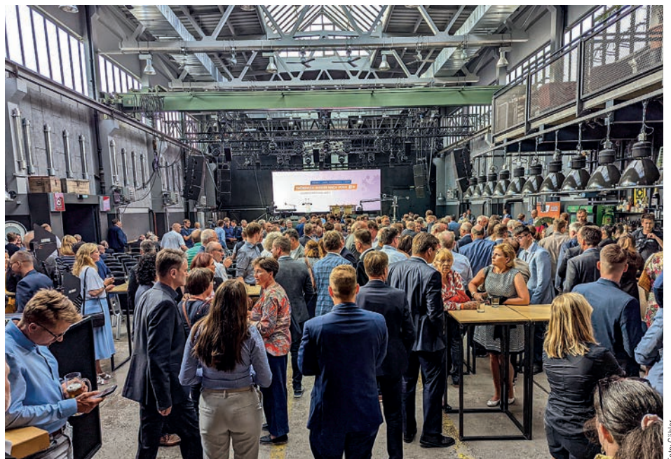
Lockere Atmosphäre beim Jahresempfang

Alles in allem werteten die GdP-Vertreter die geführten Gespräche mit CDU-Politikern und anwesenden Polizeiführern als konstruktiv und zielführend. Positiv wurde überhaupt die Möglichkeit, solche Gespräche wieder führen zu können, hervorgehoben. Sie helfen, die Bedürfnisse der Polizei an die Politiker heranzutragen, die notwendigen Hintergrundinformationen zu geben und im besten Falle zu politischem Handeln zu motivieren. Dafür sind solche Veranstaltungen eine hervorragende Gelegenheit. ■