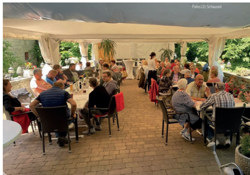
Ausklang in gemütlicher Runde