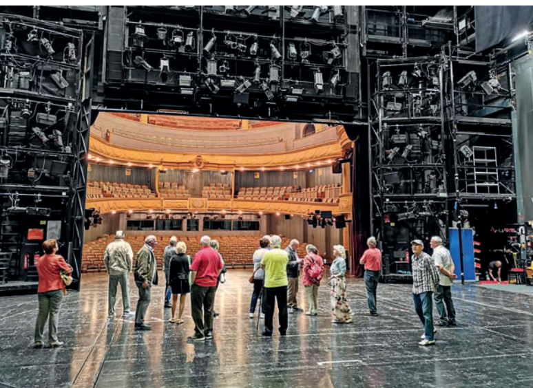
Auf den Brettern, die die Welt bedeuten