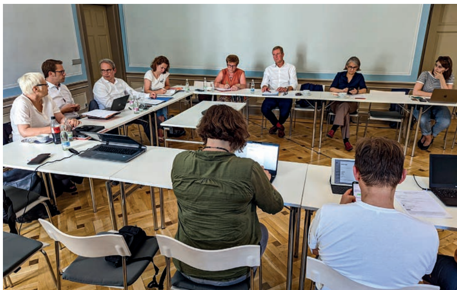
Intensive Diskussion in großer Runde

In dem dreistündigen Gespräch wurde klar, dass der DGB vom SPD-Landesvorstand eine klare Position erwartet, die dann auch von den SPD-geführten Ministerien entsprechend umgesetzt wird. DGB und SPD rangen gemeinsam um Lösungen im Interesse der Bürger des Freistaates. Die GdP hat im Interesse der Beschäftigten der Thüringer Polizei zu den angesprochenen Themen klare Positionen bezogen und wird an der Lösung der Probleme konstruktiv mitwirken. Es ist jetzt an der SPD-Führung, die Mitwirkung auch zuzulassen und einzufordern. ■