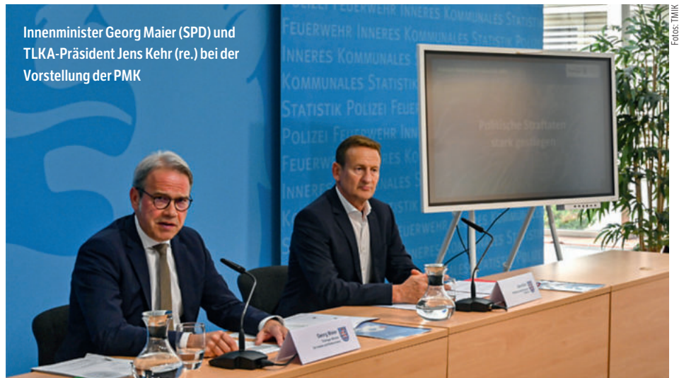
Innenminister Georg Maier (SPD) und TLKA-Präsident Jens Kehr (re.) bei der Vorstellung der PMK

Die Aufklärungsquote der Politisch motivierten Kriminalität lag bei 42,1 Prozent. Laut Aussage des Innenministers sind in Wahljahren die Zahlen der Aufklärung immer etwas niedriger, weil es im Zusammenhang mit dem Wahlkampf häufig zu Sachbeschädigungsdelikten beispielsweise an Wahlplakaten kommt. In diesen Fällen wird gegen Unbekannt ermittelt. Aufklärung lässt sich hier nur durch Video-technik oder Augenzeugen ermöglichen.