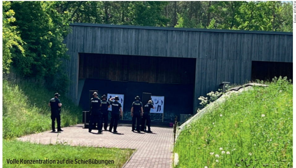
Volle Konzentration auf die Schießübungen

Nordhausen. Am 19. Mai 2022 führte die Einsatzunterstützung der LPI Nordhausen ein ganztägiges Ausbildungsschießen in der Schießanlage Gutendorf durch. Die GdP-Kreisgruppe Nordthüringen übernahm die Versorgung der Einsatzkräfte mit der Gulaschkanone.