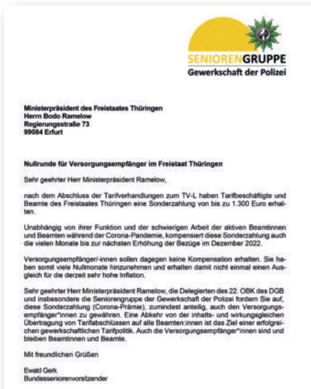
Der Brief der GdP an MP Bodo Ramelow

Thüringer Landtag Petitionsausschuss Jürgen-Fuchs-Str. 1 99096 Erfurt