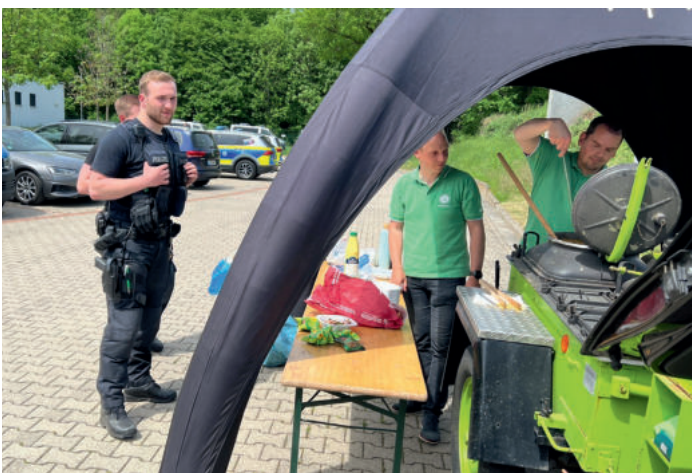
... ob die Suppe auch schmeckt?