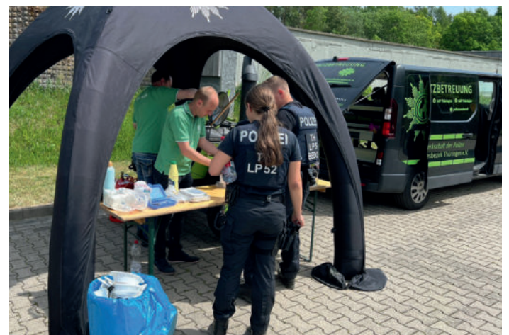
Das „Einsatzgespann“ der GdP in Aktion