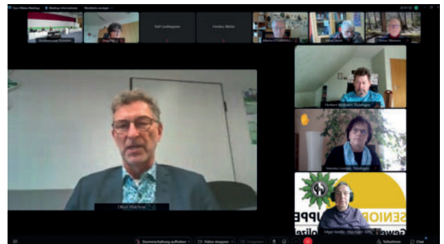
Grußwort des Bundesvorsitzenden der GdP, Oliver Malchow

für viele Menschen gerade im Alter ein wichtiger Bestandteil selbstbestimmten Lebens und von großer Bedeutung für die Verwirklichung gesellschaftlicher und persönlicher Ziele. In den vergangenen Jahrzehnten wurde in der Bundesrepublik Mobilität in erster Linie auf den individuellen Fahrzeugverkehr, insbesondere auf die Nutzung des Automobils ausgerichtet. Ziel war es, möglichst schnell von A nach B kommen zu können. Breite Straßen ohne jegliche verkehrlichen Einschränkungen galten als Maß aller Dinge. Die Städte und Gemeinden wurden autogerecht um- und ausgebaut. Umweltaspekte