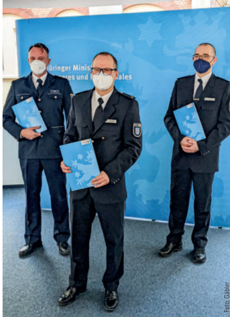
Die drei neu ernannten Polizeiräte

Drei Polizeiinspektionen in Hildburghausen, Erfurt-Nord und Sonneberg werden ab sofort im Einsatz- und Streifendienst von einem Polizeirat geführt. Die GdP gratuliert den drei neuen Polizeiräten und wünscht