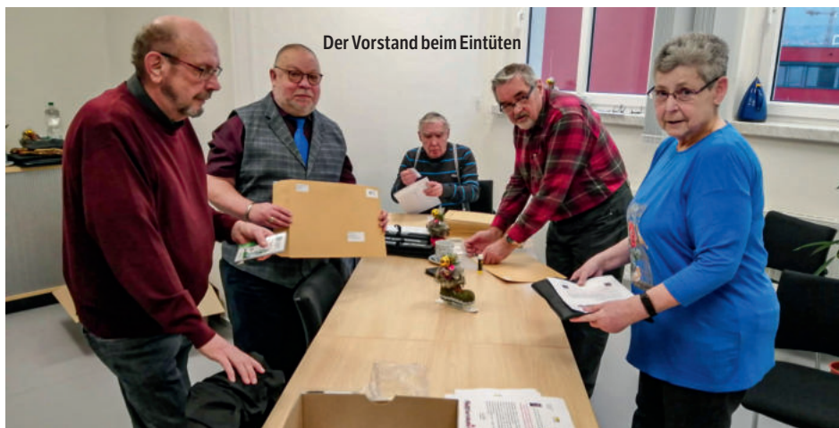
Der Vorstand beim Eintüten