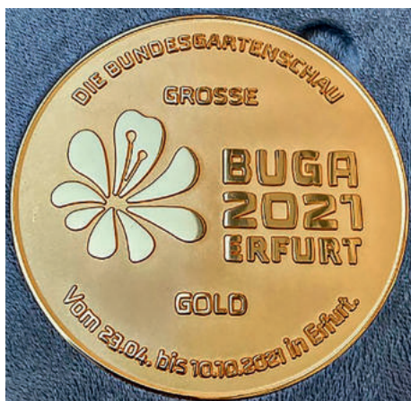
Die große Goldmedaille der BUGA 21

Marena Jödicke, GdP-Seniorengruppe Erfurt