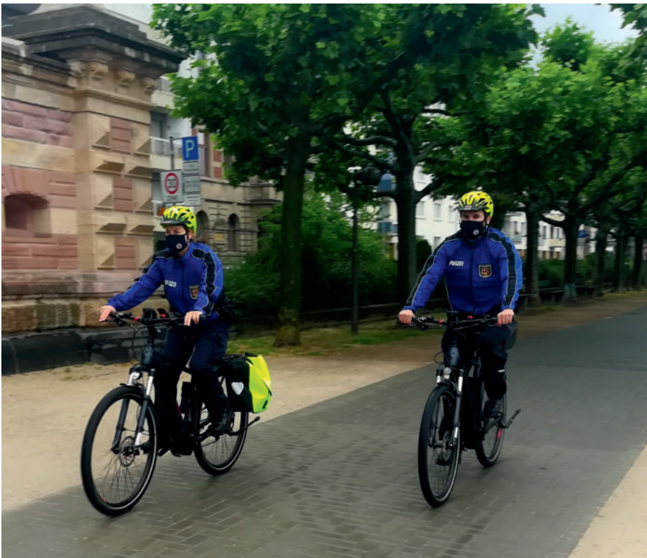
Neu beschaffte Pedelecs werden beim PP Mainz erprobt, hier beim Pressetermin am Mainzer Rheinufer.