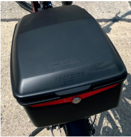
Koffer zur sicheren Beförderung von Formularen etc.

im vergangenen Jahr im Mdi vorgestellt. Damit könnte jede und jeder einen Beitrag zum Umweltschutz leisten und das täglich auf dem Weg zur Dienststelle und nach Hause. ■