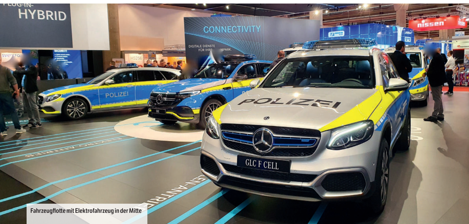
Fahrzeugflotte mit Elektrofahrzeug in der Mitte

Jedoch wie bei allen E-Fahrzeugen wird hier die Geschwindigkeit bei 180 km/h abgeriegelt, was natürlich für eventuelle Verfolgungsfahrten oder den Bereich Autobahn taktisch nicht gewollt sein kann. Fachlicher Hintergrund aus Sicht der Hersteller hierfür ist die Verringerung der Reichweite, welche bei „normaler Fahrweise“ bei ca. 450 km liegt. Je höher die Geschwindigkeit über einen längeren Zeitraum, desto geringer die Reichweite, was dann auch für den Bereich Polizei wiederum nicht zielführend sein kann.