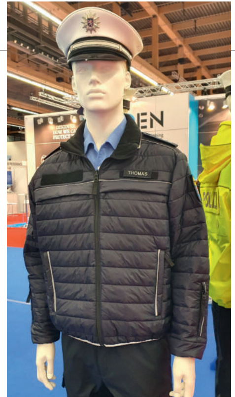
Sehr leichte, atmungsaktive Isolationsjacke

Weiter ist beabsichtigt, in absehbarer Zeit eine neuere Art von Fleecejacke zu entwickeln, welche unter der Schutzweste tragbar sein soll, ohne dass es hierbei zu einer Sekundärgefährdung z. B. durch den Reißverschluss kommen kann. Beschussversuche seien bereits erfolgt, die Jacke sei jedoch noch nicht als Serie in der Produktion.