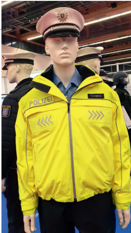
Tragevariante 2, wasserdichte Regenjacke

Neue interessante Entwicklungen gab es im Bereich der Bekleidung. Hier wurden gerade von unserem Kooperationspartner, der Polizei Hessen, neue Bekleidungen erdacht und bereits in Piloten getestet. Ein Gespräch mit der hierfür verantwortlichen Kollegin aus dem Bereich SG-211 des Hessischen Polizeipräsidiums für Technik, brachte uns hilfreiche Erkenntnisse zu ei-