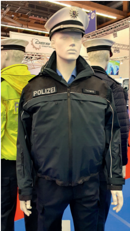
Tragevariante Nr. 1 für den alltäglichen Dienst

Weiter wurde auch ein Testfahrzeug mit Plug-in-Hybrid vorgestellt, welches jedoch laut Mitarbeiter vor Ort voraussichtlich nicht in Serie gehen sollte, da diese Technologie nicht gefördert werde. Ebenso neu bei der Ausstellung war die Firma Tesla, welche gleich zwei Fahrzeuge für den Bereich Polizei vorstellte.