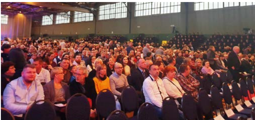
Gut gefüllt war die Sport- und Kongresshalle in Güstrow

Die Gewerkschaft der Polizei (GdP) Mecklenburg-Vorpommern wünscht Euch ein sorgloses Berufsleben sowie stets gutes Gelingen im Dienst für die Sicherheit in Mecklenburg-Vorpommern und seiner Bewohnerinnen und Bewohner.