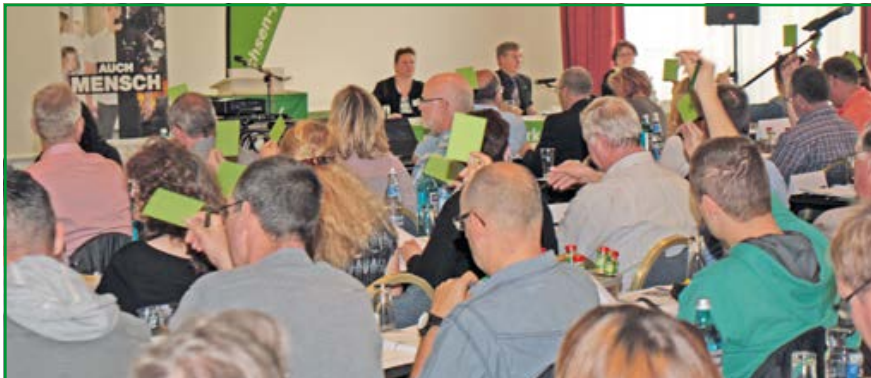
Auf dem 7. Landesdelegiertentag wurden die Weichen für die nächsten fünf Jahre gestellt.