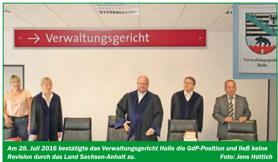
Am 28. Juli 2016 bestätigte das Verwaltungsgericht Halle die GdP-Position und ließ keine Revision durch das Land Sachsen-Anhalt zu.