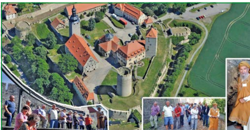
Die Burg Querfurt und ihre Besucher.