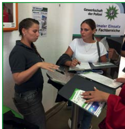
Die Berufsvertretungsstunde: für viele der erste Berührungspunkt mit ihrer GdP

Die GdP hat ein umfangreiches Versicherungspaket im Mitgliedsbei-