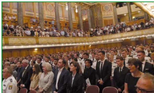
Graduierungsfeier am 5. Juli 2019 in Wiesbaden

5. Juli 2019. Es ist so weit. Ich bin dabei. Ich werde Polizeikommissar bei der hessischen Polizei. Ich habe drei Jahre Studium hinter mir. Ich habe alle Modulprüfungen geschafft und freue mich auf den ersten Stern. Auch die Graduierungsfeier wird von der GdP unterstützt. Ich freue mich auf meine neue Dienststelle und weiß, dass ich auch nach dem Studium einen starken Partner an meiner Seite habe: die GdP.