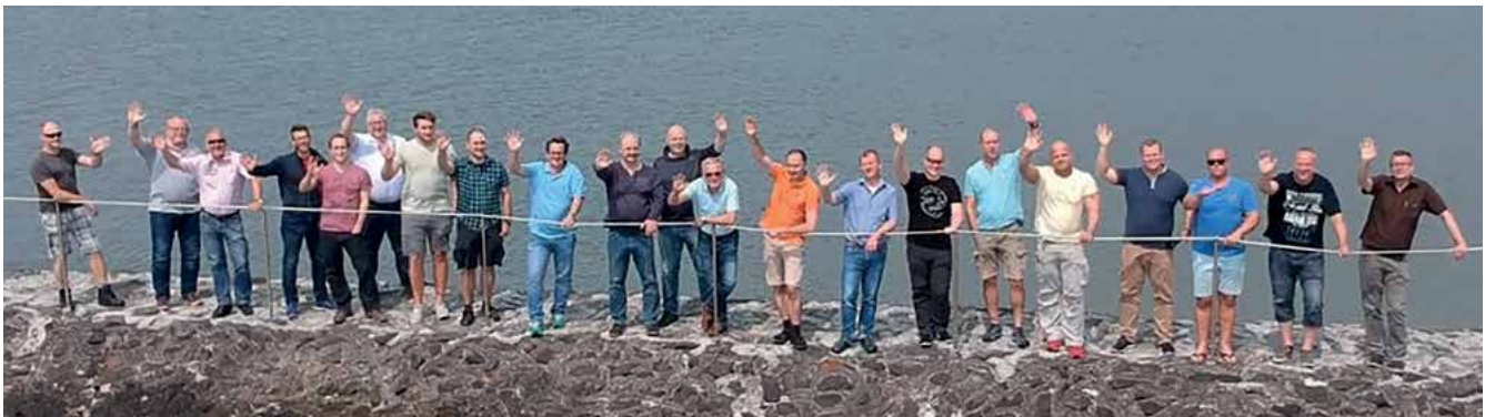
Die Seminarteilnehmer fühlen sich nicht nur berufsbedingt am und auf dem Wasser wohl

Mit Blick auf die Bezüge ist die Polizei Bremen für qualifiziertes Fachpersonal aus dem maritimen Sektor jedoch unattraktiver geworden. Im