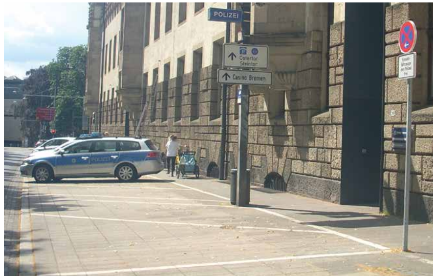
Freie Parkplätze für Streifenwagen vor dem Polizeikommissariat Mitte. Es fehlt an Fahrzeugbesetzungen.

Bei Prio-1-Einsätzen sind wir gut. Okay. Aber nur, weil Kolleginnen und Kollegen oftmals Sonder- und Wege-rechte in Anspruch nehmen, um eine interne zeitliche Vorgabe erfüllen zu