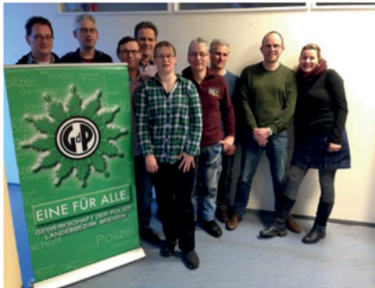
Vorstand der FG Zentrale Dienste 2018

Die dreitägige Veranstaltung mit dem Titel „Die Gewerkschaft in der Gesellschaft“ findet vom 09.09. – 11.09.19 im Nordseebad Tossens statt und kann mit Bildungsurlaub besucht werden. Musteranträge sind auf Anfrage in der GdP- Geschäftsstelle erhältlich.