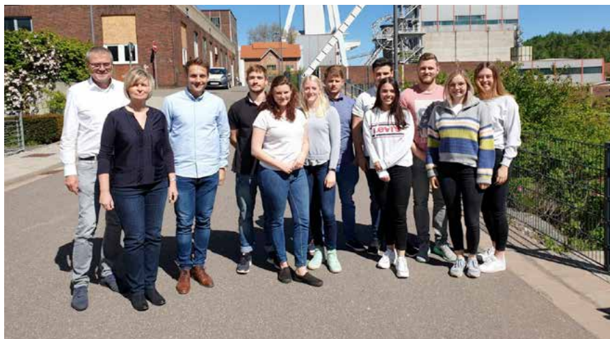
Der Wahlvorstand mit der neu gewählten JAV