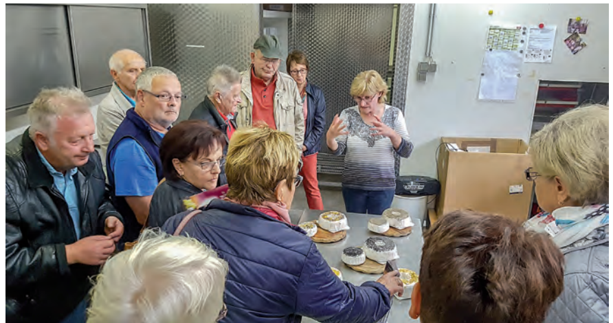
Gleich dürfen alle kosten

Zum Schluss gab es noch eine ausgiebige Verkostung und wir konnten uns zum Werksverkaufspreis mit Käse eindecken, was auch ausgiebig genutzt wurde. Wir bedankten uns für die freundliche Führung und für die Erweiterung unseres Wissens. Ein kleiner Polizei-Teddy sollte sie an 23 wissbegierige Käseinteressenten erinnern. Den Nachmittag schlossen wir bei Kaffee und Kuchen im Ökozentrum Vachdorf ab. A. Schauseil