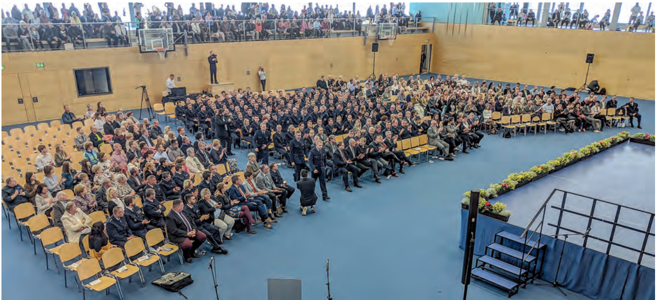
Viele Gäste gaben den Absolventen die Ehre