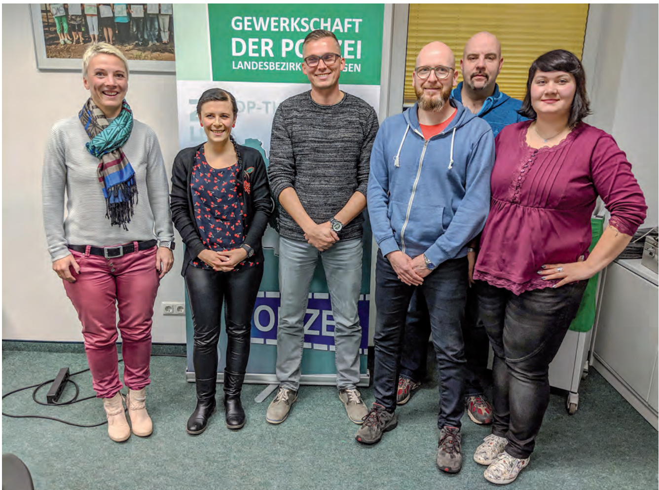
Der neu gewählte Kreisgruppenvorstand