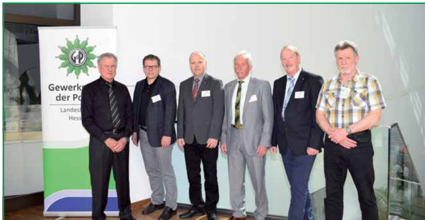
Die Mitglieder des Landesschiedsgerichtes Hessen

Wie sich in den vergangenen vier Jahren herausgestellt hat, war die Entscheidung des Bundeskongresses, weitere Organe (Landes- und Bundesschiedsgericht) zu etablieren und eine umfangreiche Schiedsordnung