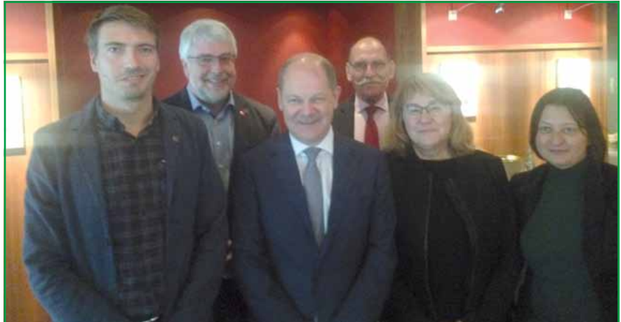
Von vorne links: Christoph Möhring (GdP), Vize-Kanzler Olaf Scholz (SPD) mit weiteren Vertretern der DGB-Gewerkschaften im Hotel Gude in Kassel.

Natürlich wurde auch auf die Situation der Polizei in Nordhessen eingegangen. So wurden Olaf Scholz ungefiltert die Problemfelder skizziert welche uns im täglichen Dienst begegnen. Personalsituation, Bezahlung, Überstunden, fehlende Beförderungsmöglichkeiten, zu kleine Investitionsetats etc. Die steigende Gewalt und Respektlosigkeit gegenüber den Vertretern des Staates wurde ebenfalls angesprochen. Verbunden mit der Aufforderung,