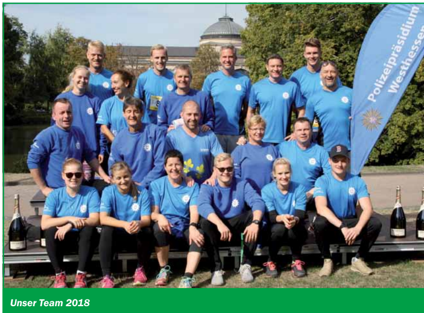
Unser Team 2018

Wer kann schon schlafen, wenn im Wiesbadener Kurpark 25 Stunden lang die „Post“ abgeht?