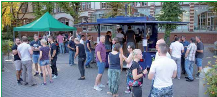
Nach der Eröffnung füllt sich das Brunnenfest schnell.

Alle Vorbereitungen waren von der misslichen Wettersituation aus 2017 geprägt. Hier waren trotz Sommerzeit äußerst ungemütliche Temperaturen und Starkregen vorherrschend, sodass das Brunnenfest fast vollständig „ins Wasser fiel“. Für dieses Jahr hatten wir mit erhöhtem Aufwand eine Zeltlandschaft aufschlagen lassen, um wetterunabhängig das Brunnenfest begehen zu können. Im Ergebnis hatten wir nach dem „Supersommer 2018“ auch zum diesjährigen Brunnenfest hochsommerliche Temperaturen. Die Festzeltgarnituren waren schnell besetzt. Gegrilltes und frisch Gezapftes füllte die Tische. Siegerpokale füllten sich und unser traditionelles Brunnenfest startete aus dem Stand. Wie immer durchmischen sich die Gruppierungen