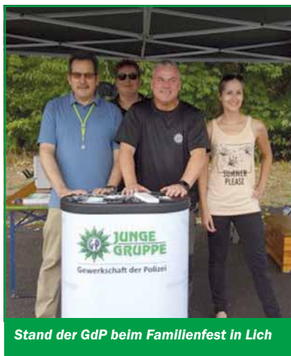
Stand der GdP beim Familienfest in Lich

Am 24. 8. 2018 beging die II. BPA Lich das diesjährige Familienfest. Wir von der Bezirksgruppe Bereitschaftspolizei hatten uns im Vorfeld vorgenommen, die Bestands-Mitgliederpflege der GdP insgesamt zu intensivieren. Im Schulterschluss mit der KG Lich betrieben wir einen Pavillon auf dem Parkgelände der II. BPA im Aufgangsbereich zum Limes Camp. Als „Eyecatcher“ engagierten wir eine Fotobox. Hier konnten sich Bedienstete mit ihren Kindern, Enkelkindern und oder Partnern ablichten lassen und das Foto direkt als Andenken mit nach Hause nehmen. Kinder in Körperschutzausstattung, Uniformteilen oder sonstigen originellen Outfits frequentierten unseren