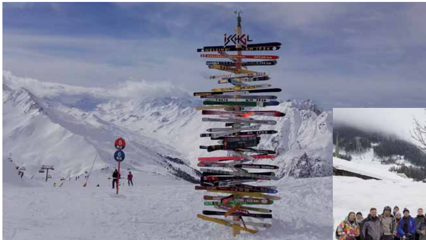
So erwartete uns Ischgl, eine Winter-Traumlandschaft

genen vorhanden, eindeckte. Ein paar Unerschrockene stürzten sich direkt ohne sportliche Betätigung in das Abenteuer „Apres Ski“. Auf dem Berg selbst erwartete die Sportler Kaiserwetter und bis zum frühen Nachmittag geniale Pistenbedingungen. Gegen Abend ließen alle Teilnehmer den Tag beim „Apres Ski“ ausklingen. Um 23.00 Uhr ging ein langer Tag zu Ende und per Bus ging es wieder zurück in Heimat. Wegen der tollen Resonanz wird es wohl auch im kommenden Jahr eine Neu-