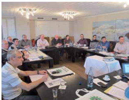
Echtes Engagement und Lernbereitschaft – Unser Kompetenzteam Beihilfe

Der Landesbezirk bedankt sich bei allen Teilnehmern und Referenten für