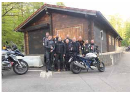
Die GdP-Biker zu Beginn des Trainings

Während des kurzen Boxenstopps wurden bei einer „Rostwurst a la Bruno“ die ersten Erfahrungen ausgetauscht.