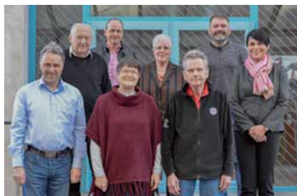
Alle Geehrten der KG LPP (links/Mitte/rechts)

Traditioneller Tagesordnungspunkt unserer Versammlung waren einmal mehr die Ehrungen verdienter, lang-