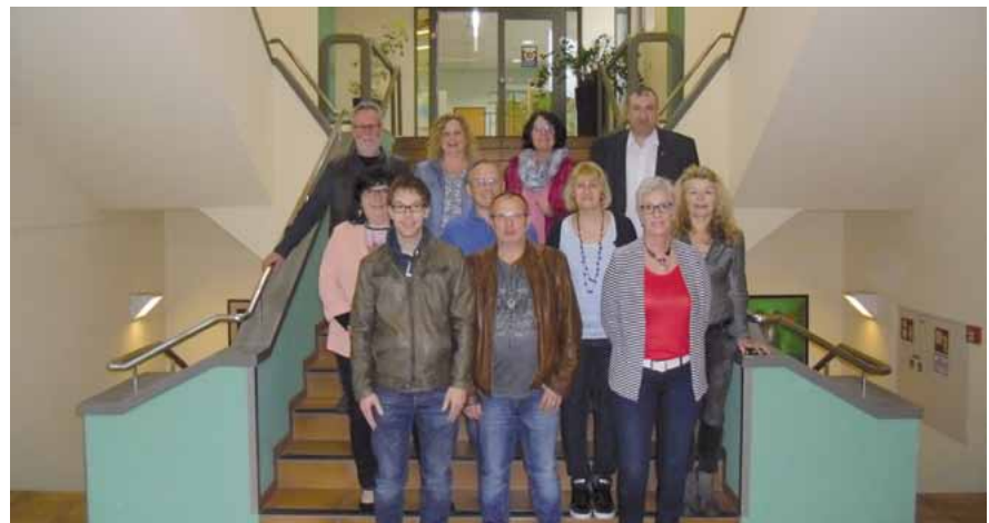
Gut gelaunte und erwartungsvolle Seminaristen beim Tarifseminar 2018.

von 30 Monaten, einer Einmalzahlung von 250 Euro für die Entgeltgruppen 1-6 und weiteren Verbesserungen im Bereich der Auszubildenden ein Gutes und sollte durchaus als Messlatte (mit Ausnahme der Laufzeit!) für unsere Ta-