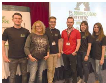
Unsere Delegierten beim BJK

Die über 100 Delegierten stellten durch die Wahl des neuen geschäftsführenden Bundesjugendvorstands und die Verabschiedung zahlreicher Anträge die Weichen für die kommenden vier Jahre. Für uns bot die Konferenz darüber hinaus noch die Gelegenheit, sich mit den Kolleginnen und Kollegen anderer Bundesländer bzw. vom Bund aber auch mit dem Bundesvorstand