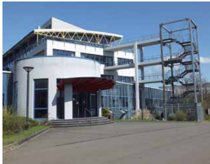
Gebäudeeingang ehemaliges PRAKTIKER-Gelände in Kirkel

Der Gebäudezustand im Polizeiareal „Wackenbergl“ und die damit verbundene Unterbringungssituation der dort befindlichen Dienststellen, insbesondere der Bereitschaftspolizei,