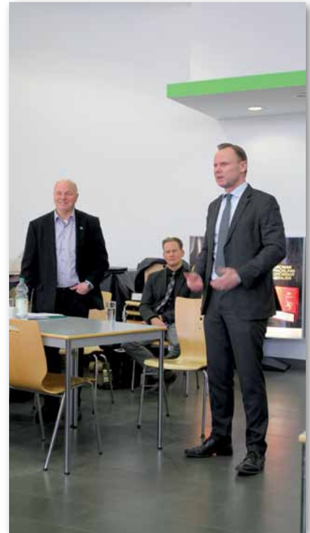
Innensenator Grote schilderte anschaulich die Ereignisse rund um den G20-Gipfel.