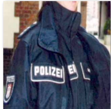
Und in Hamburg?

die Dienststelle auf, im Zusammenhang mit der von uns geforderten flächendeckenden Einführung der ATH auf den Sicherheitsaspekt durch eine verbesserte Sichtbarkeit zu setzen.