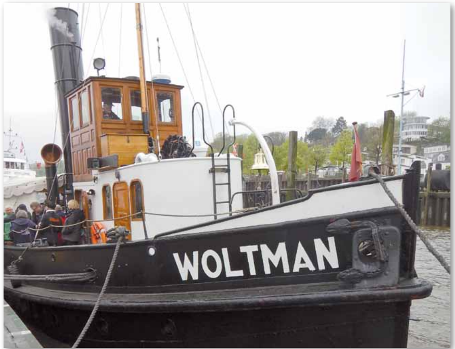
Bereit zur Abfahrt: Der Dampfschlepper „Woltman“