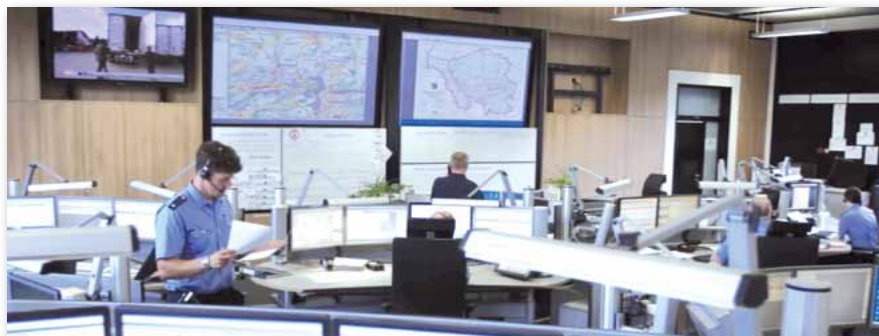
Führungs- und Lagezentrum der Polizei des Saarlandes (FLZ)

Am 15. 2. 2017 hat nun der BFH für uns überraschend in einem Revisionsverfahren (Az.: VI R 30/16), das in der Vorinstanz bei einem anderen Senat