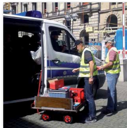
Kreativ: GdP-Senioren mit dem Bollerwagen unterwegs

treuungskräften eine große Rolle. Wir, der GdP-Landesbezirk Hamburg, dankt allen Seniorinnen/Senioren für ihre großartige Leistung anlässlich der Betreuungsaktion. Es hat ihnen nicht nur Spaß und Freude bereitet zu helfen, sondern sie haben