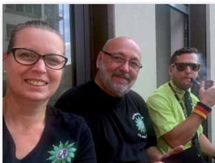
In unserer Mitte: unsere GdP-Senioren