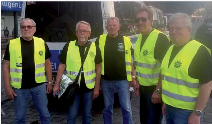
Alle haben geholfen, Senioren in der GdP.

Mit einem ganz großen Engagement haben unsere GdP-Senioren der norddeutschen Landesbezirke während der o. g. Zeit in Teams mit den Hamburger GdPlern (und Senioren) die eingesetzten Kräfte im Hamburger Stadtgebiet aufgesucht und mit Warm- und Kaltgetränken, Obst, Speiseeis, Salzgebäck und Sonnen-