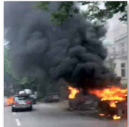
Mitten auf der Elbchaussee über 30 Brände

te Herr werden können. Und war auch für die Durchführung des G20-Gipfels richtig, der störungsfrei durchgeführt werden konnte. Das Ausmaß krimineller Gewalt und die Bereitschaft, ohne Rücksicht sinnlose Zerstörung am Rande des Gipfels zu verüben, war zwar in seiner Dimensi-