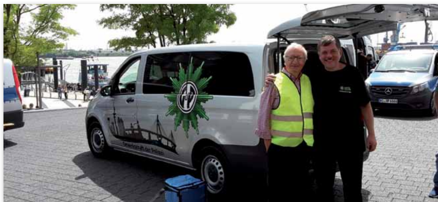
Das ist Solidarität: der ehemalige Polizeipräsident Dieter Heering (80 Jahre) zusammen mit „Kirsche“ in der Einsatzbetreuung unterwegs.

treuungskräften eine große Rolle. Wir, der GdP-Landesbezirk Hamburg, dankt allen Seniorinnen/Senioren für ihre großartige Leistung anlässlich der Betreuungsaktion. Es hat ihnen nicht nur Spaß und Freude bereitet zu helfen, sondern sie haben