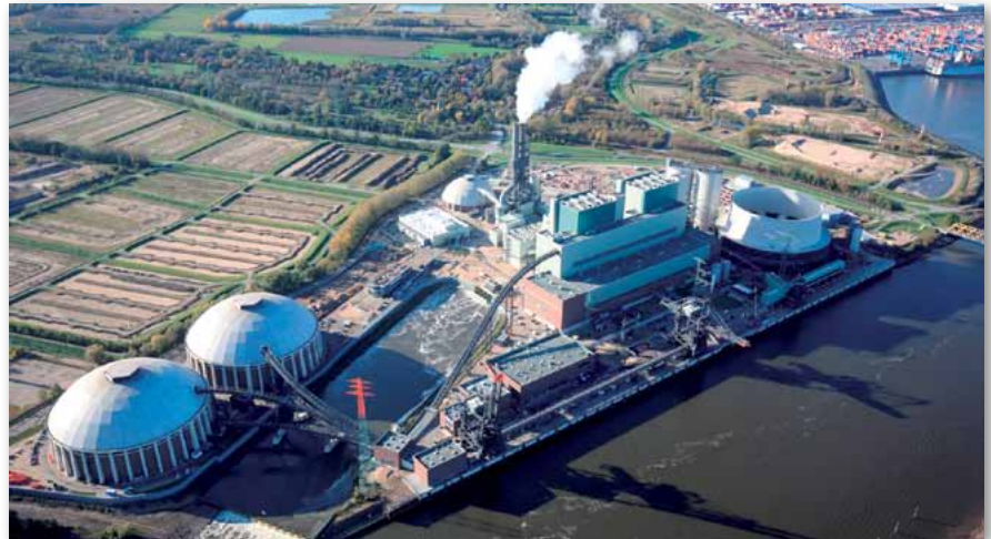
Beeindruckend aus der Luft: das Heizkraftwerk Moorburg

Die Veranstaltung wird ca. drei Stunden dauern und ist für uns kostenfrei. Bitte denkt an eine wetterfes-