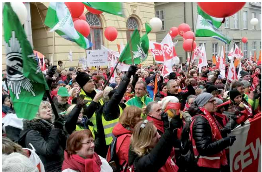
Tarifverhandlungen 2017 – Streikkundgebung in Schwerin