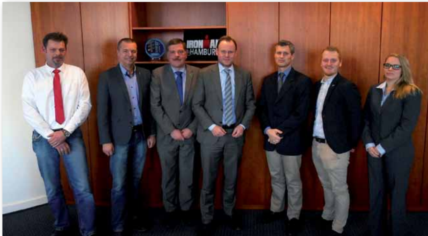
Zu Gast in der Innenbehörde: die GdP

zweischneidig macht, ist die Tatsache, dass sie zu ihrer Regierungszeit im Wissen der schon damals absehbaren Personalprobleme viel zu wenig Nachwuchs eingestellt hat. Exemplarisch wurden 2007 ganze 84 (gD/mD) – 2008 181 (gD/mD) und 2009 183 (gD/mD) eingestellt. Nach dem Regierungswechsel 2011 wurden dann „von der SPD“ jährlich 250 Neueinstellungen vorgesehen, was in Anbetracht von ca. 10% Abgängen (Ausbildungsende nicht erreicht) zwar deutlich mehr, aber lange nicht ausreichend war. Die Schläfrigkeit der Politik, die nicht auf den „gewerkschaftlichen Wecker“ gehört hat, hat uns alle in diese Situation gebracht. Nun wird es darum gehen, den faktischen Generationswechsel in der Hamburger Polizei ad hoc hinzubekommen. Da stehen wir ganz konkreten Herausforderungen (Ausbildungspersonal, Praktikantenausbildung, Raumprobleme, Personalärztlicher Dienst etc.) gegenüber. Deshalb wären zukünftig konkrete Lösungsvorschläge, die auch aus gewerkschaftlicher Sicht für die Kolleginnen und Kollegen tragbar sind – egal von wem – hilfreicher.