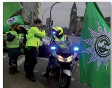
Warnstreik und Gespräche mit Einsatzkräften