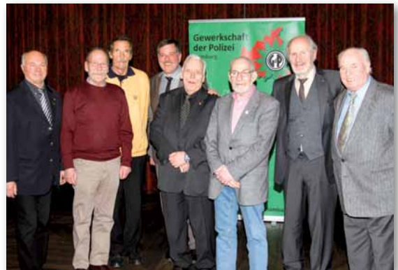
Unsere 60 Jahre Jubilare