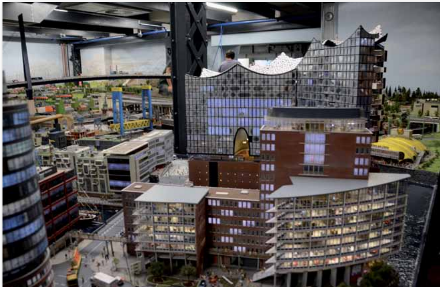
Auch im Miniatur Wunderland fertig: die Elbphilharmonie