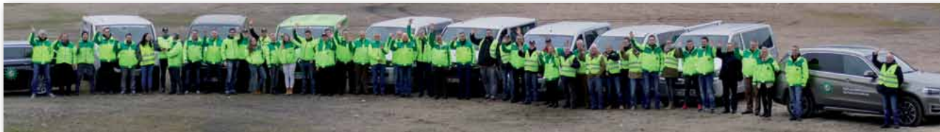
Eine große Gemeinschaft: die GdP

Am 7. und 8. Juli 2017 wird Hamburg ein weiteres Mal nach OSZE auf die Probe gestellt und empfängt ca. 16 000 Kolleginnen und Kollegen aus allen Bundesländern, um den G20-Gipfel sicher und friedlich über die Bühne zu bringen.