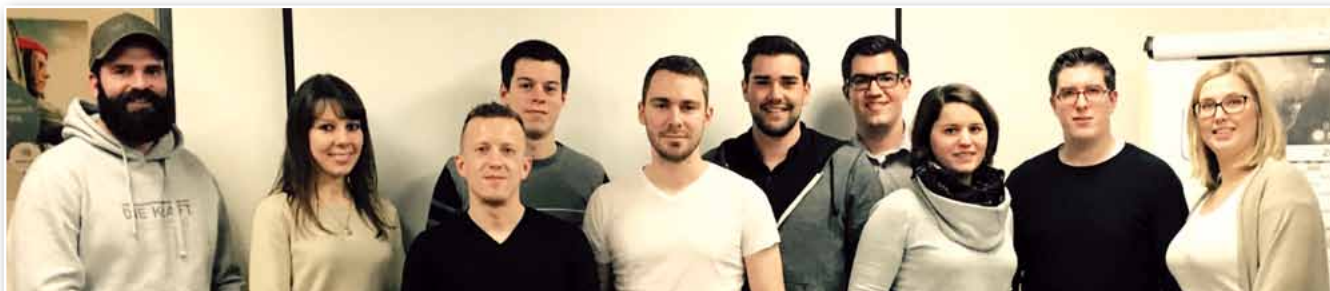
Gutes Einvernehmen mit der JU beim Thema: „Wir brauchen nicht weniger, sondern mehr Polizei im Saarland!“