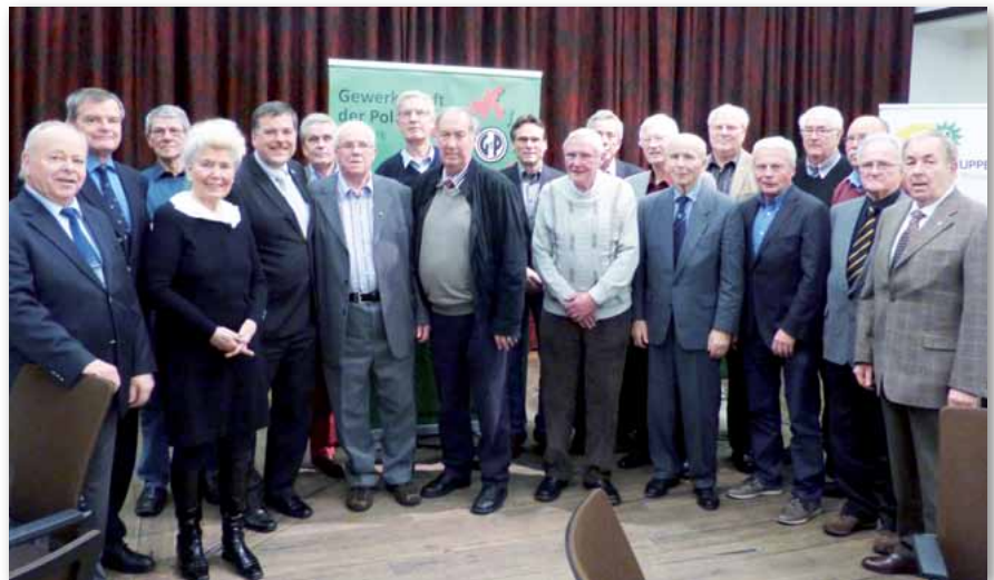
Gruppenbild mit Dame: Herzlichen Glückwunsch für 50 Jahre Gewerkschaftsmitgliedschaft.