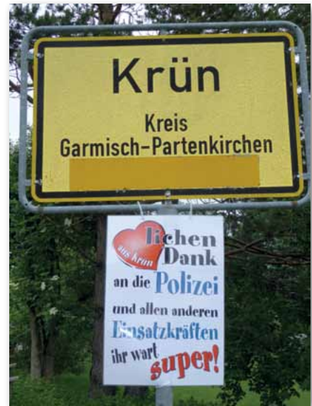
Ein Bild, das für sich selber spricht!

Leider hatten gerade diese beiden Punkte (Wetter und Wegenetz) mit fortschreitender Einsatzdauer zunehmende Auswirkungen auf unsere Ar-