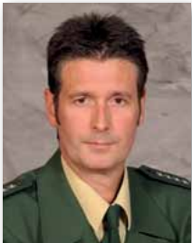
Reiner Hartz

Alle Einsatzkräfte am 9. Juni 2015 unverletzt zurück in Saarbrücken