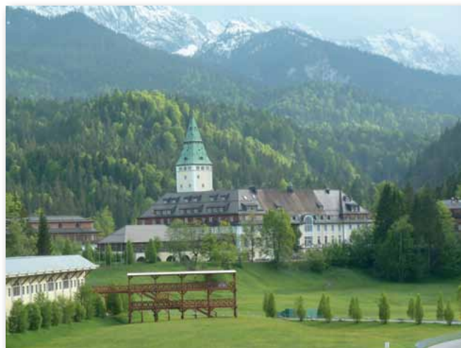
Was für ein Panorama? Ein Blick auf Krün – umwerfend schön!

Die erste Schicht begann dann mit einer Frühschicht, bei der wir zunächst als Eingreifkräfte im Einsatzgebiet S2 in Bereitschaft gehalten wurden. Unsere Hauptaufgabe war es hier, auf Sichtungen der Linienkräfte oder auf das Auslösen der Alarmanlage zu reagieren. Dies gestaltete sich bei gutem Wetter die ersten vier Tage problemlos, und die erwarteten Störaktionen von Antifa und Co. blieben aus. Versorgt wurden wir im Einsatzgebiet von Freiwilligen des Bayerischen Roten Kreuzes, die mithilfe einer großen Gulaschkanone der Bundeswehr für warme Mahlzeiten sorgten.