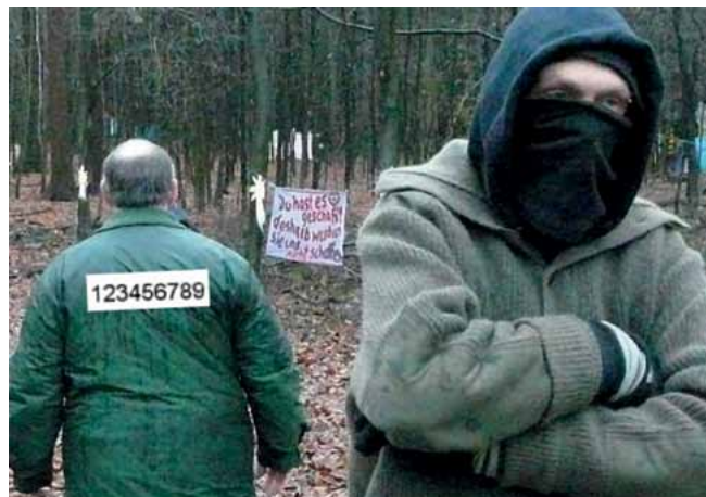
Das Preisgeben der Identität gilt nicht für alle!

In der letzten Legislaturperiode hat der hessische Innenminister in enger Beteiligung mit dem Hauptpersonalrat der Polizei eine zusätzliche „taktische Kennzeichnung“ der Einsatzkräfte abgestimmt. Dies ist aus unserer Sicht völlig ausreichend! „Mit mir wird es keine weitere Kennzeichnungspflicht geben!“, so der Innenminister noch im Juni 2013 zu den Plänen von Bündnis 90/Die Grünen.