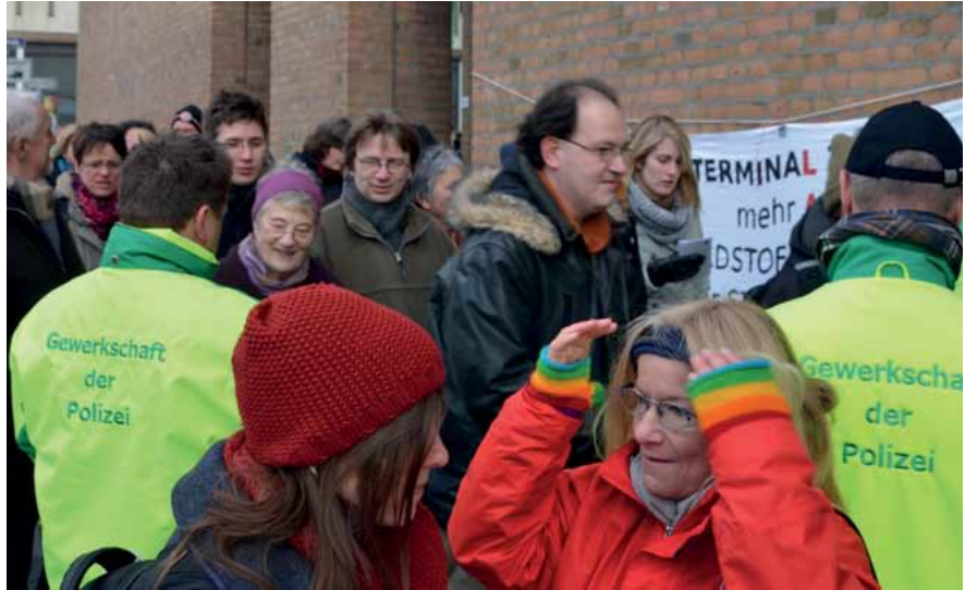
Die GdP händigte den Delegierten vor Beginn der Mitgliederversammlung einen Flyer aus. Wir wollen nur das, was uns bei den Wahlprüfsteinen versprochen wurde!

Machterhalt um jeden Preis, dies scheint hier ganz offensichtlich die