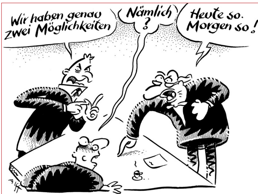
Zu oft „rein in die Kartoffeln“ und dann wieder „raus aus den Kartoffeln“. Die Bundespolizei braucht Ruhe; vor allem bei den operativ tätigen Kolleginnen und Kollegen.

Die neue Zulage erfüllt unsere Vorstellungen weitestgehend. Sie wird zahlbar ohne Anrechnung der Polizeizulage, Anwarter werden während ihrer Praktika nicht mehr ausgeschlossen. Die Anwendung auf alle Arbeits-