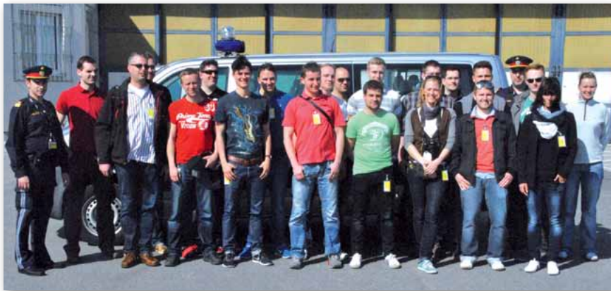
Gruppenbild mit allen Teilnehmerinnen und Teilnehmern auf dem Wiener Flughafen.

Leider geht jedes Seminar einmal zu Ende, sodass wir alle Seminarpunkte der Woche abschließend Revue passieren ließen. Zudem nahmen wir uns Zeit für eine Seminarkritik. Hierbei konnte sich jeder Teilnehmer zu allen Punkten äußern und Verbesserungsvorschläge anbringen. Das Fazit der Teilnehmer zu den Seminarinhalten war einheitlich durchweg positiv. Ebenfalls waren sich alle