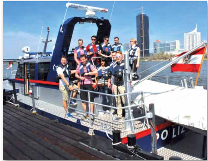
Auch ein Highlight: Die Unterweisung auf dem Wasserschutzpolizeiboot.