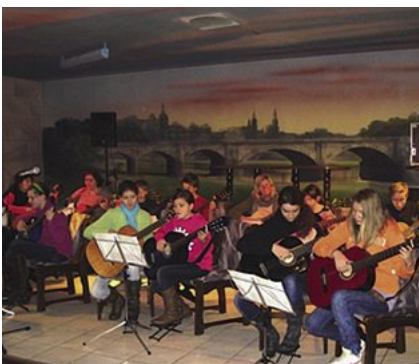
Das Gitarrenorchester der Dresdener „Makarenko-Schule“