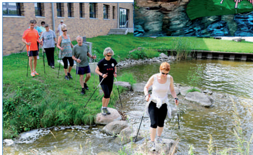
Nordic Walking stand auf dem Programm.

Traumfigur gelangen könnten. Abgehen davon waren wir Teilnehmer auch nicht weit entfernt davon.