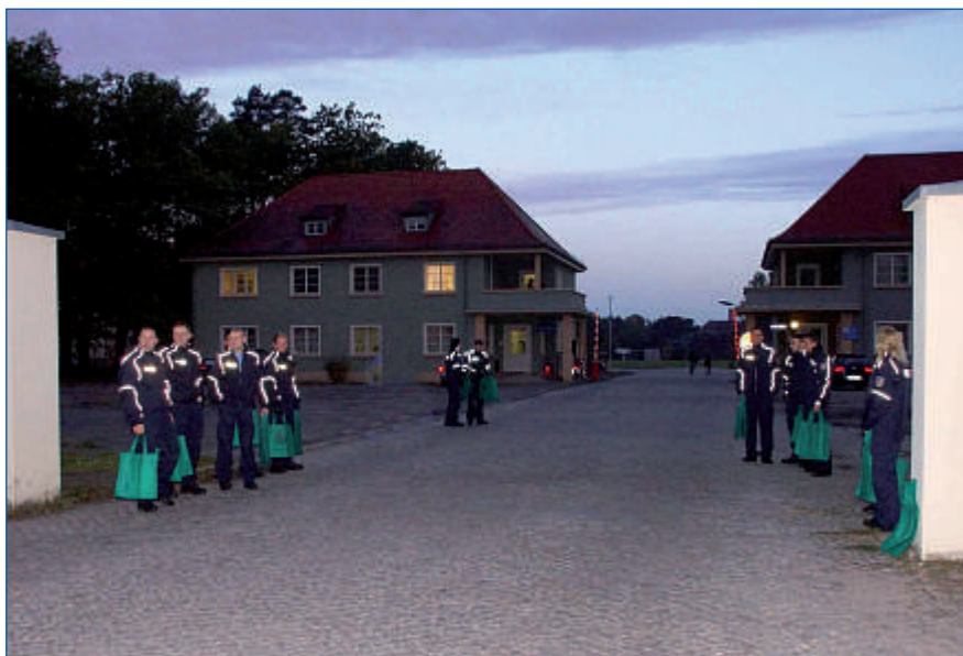
Begrüßungsspalier am frühen Morgen.