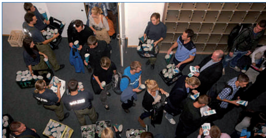
Schultüten für unsere Neuen

und Studierenden nach erfolgreicher Ausbildung eingesetzt. Wenn Ihr Euch für die GdP entscheidet, habt ihr eine starke Organisation im Rücken. Denn die Risiken eines mitunter gefährlichen Berufes darf und kann niemand allein tragen. Die Gewerkschaft der Polizei bietet ihren jungen Kolleginnen und Kollegen deshalb Leistungen an, die entweder durch den Mitgliedsbeitrag abgegolten sind oder durch Gruppen- bzw. Rahmenverträge zu besonders günstigen Konditionen in Anspruch genommen werden können. Die wichtigste Leistung der GdP ist die Vertretung Eurer beruflichen und sozialen Interessen gegenüber der Politik. So wollen wir bei den Verhandlungen mit der Landesregierung über die Zahlung einer Sonderzuwendung (Weihnachtsgeld) nicht zulassen, dass in Brandenburg dieser feste Teil unserer Bezüge ohne Kompensation dauerhaft auf Null gesetzt wird. Trotz aller objektiven Sparzwänge muss die langfristige Etablierung einer Billigpolizei in unserem Land verhindert werden. Dafür brauchen wir schon im November anlässlich unserer großen Demo in Potsdam Eure Hilfe.