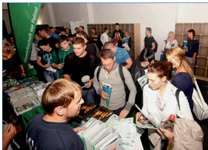
Infos vom Anwärter für die Anwärter.

Doch nun zu Euch. Ihr seid das erste Mal auf Euch alleingestellt. Nicht nur beim Lernen während des Studiums bzw. der Ausbildung, sondern auch bei der Bewältigung ganz alltäglicher Dinge, wie etwa der Finanzierung der ersten eigenen Wohnungseinrichtung. Aber auch das