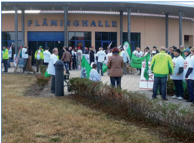
Zum SPD-Parteitag machte die GdP wieder mobil.

sicherungspflichtiger Tätigkeit festzumachen. Was bedeutet, theoretisch mit 63 Jahren abschlagsfrei in Rente gehen zu können.