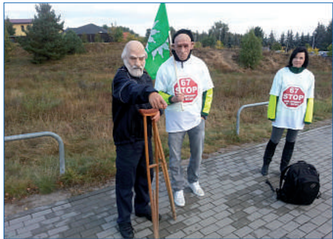
Junge Gruppe 2020

vornehmen, um ein bundespolitisches Signal zu setzen. Eine Politikerin hat es getan. Dagmar Enkelmann, die Linke, hat genau dieses eingefordert und es findet unsere Hochachtung. Andere haben gesagt, dass in dem neuen Vorschlag von Innenminister Woidke man einen gesunden Kompromiss gefunden hätte, man mehr wollte, aber mehr derzeit nicht umsetzbar ist.