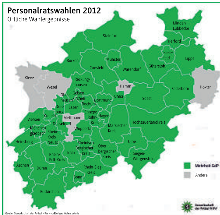
Quelle: Gewerkschaft der Polizei NRW - vorläufiges Wahlergebnis