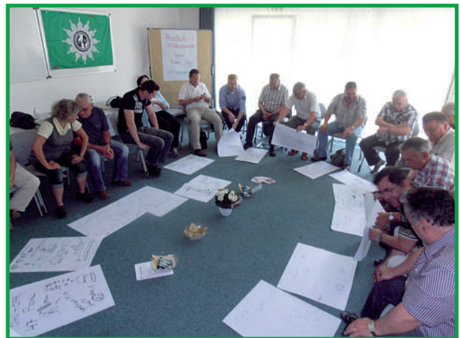
und tolle Ideen.

Am letzten Tag war dann noch mal die Kreativität der Seminarteilnehmer gefragt. In einem Ideenwettbewerb ging es darum, ein neues Logo für unsere Einsatzbetreuung zu finden, das einen hohen Wiedererkennungswert hat. In vielen lustigen Bildern und Vorschlägen wurde eine Vielzahl von Ideen zusammengetragen, aus denen wir jetzt einen Entwurf „basteln“ wer-