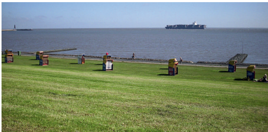
Die Deutsche Bucht vor Cuxhaven

spricht für gutes Erinnerungsvermögen. Hätte er den jüngsten Fall in der Ostsee der litauischen Fähre „LISCO GLORIA“ genannt, hätte seine Argumentation nicht getragen.