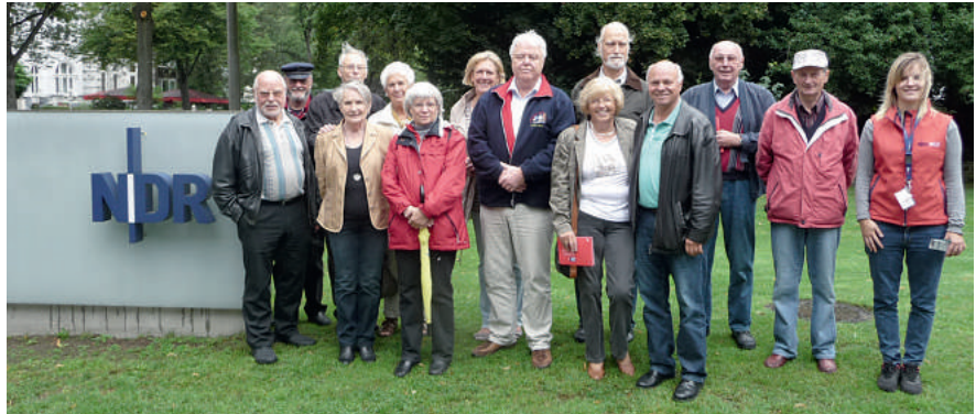
Beeindruckende Einblicke in den Sendealltag des NDR für GdP-Senioren.

Anschließend wurde uns noch die Technik aus den vergangenen Jahrzehnten gezeigt, wie z. B. die verschiedenen Mikrofone, Kameras, Aufzeichnungsgeräte und die Aufzeichnungsbänder bis zum heutigen Chip.